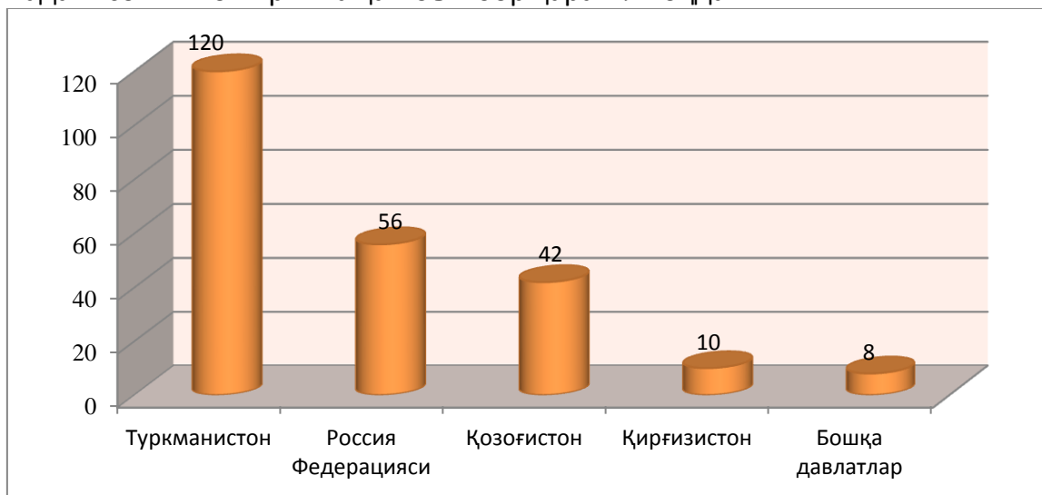
Расм 1. 2017/2018 ўқув йилида мустақил давлатлар ҳамдўстлиги мамлакатлари ва бошқа хорижий давлатларидан қабул қилинган талабалар сони, киши.

Бу, шундан далолат берадики мамлакатимиз таълим сифатини ошириш ва салоҳиятли кадрлар орқали, таълим инфратузилмасини янги босқичга кўтариш мақсадида амалга оширилаётган чора-тадбирлардир. Албатта, нафақат мамлакатимиз фуқароларининг хорижий олий таълим муассасаларида янги билим кўникмасини шакллантириш, балки, хорижий давлат фуқароларининг сезиларли даражадаги сонини оширишга ҳам эътибор қаратилмоқда.