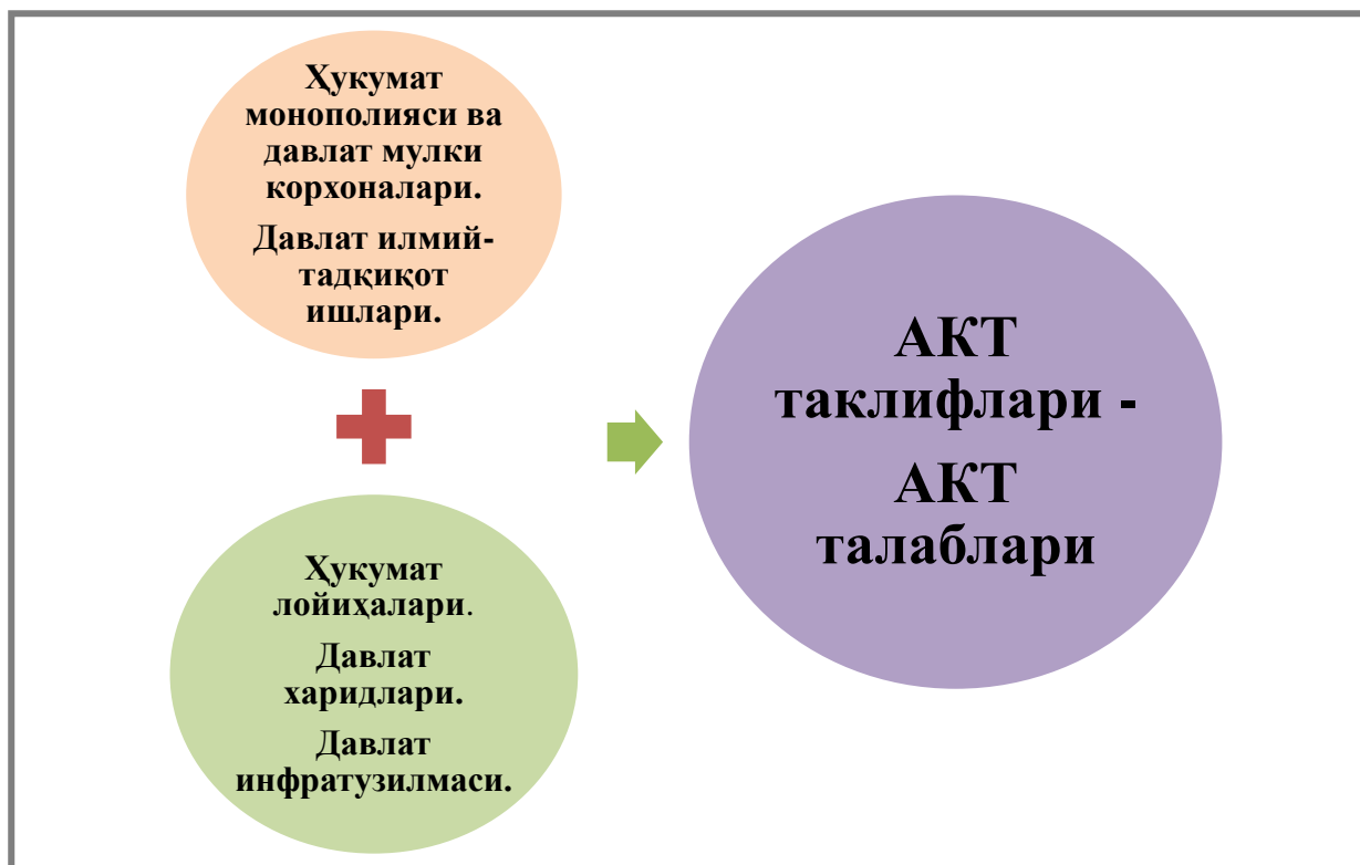
1-расм. Давлатнинг АКТга бевосита таъсирининг тамойиллари 1

АКТни мустақил тартибга солиш ечимлари ҳисобланадиган рақобат ва хусусийлаштиришдан ташқари, яна бир муҳим омил бу ҳар қандай миллий иқтисодиётнинг ўзига хослик хусусиятларидир. Шунинг ҳисобга олган ҳолда АКТни миллий иқтисодиётнинг қиёсий устунлигидан фойдаланиб татбиқ этишнинг оқилона вариантларини излаш кўпроқ аҳамият касб этади. Бу ўз навбатида дифференциал ёндашувларга, миллий АКТнинг рақобатбардошлигини орттиришга ва замонавий тармоқ технологияларини татбиқ этиш ва фойдаланишга тайёргарлигини кучайтиришга хизмат қилади.