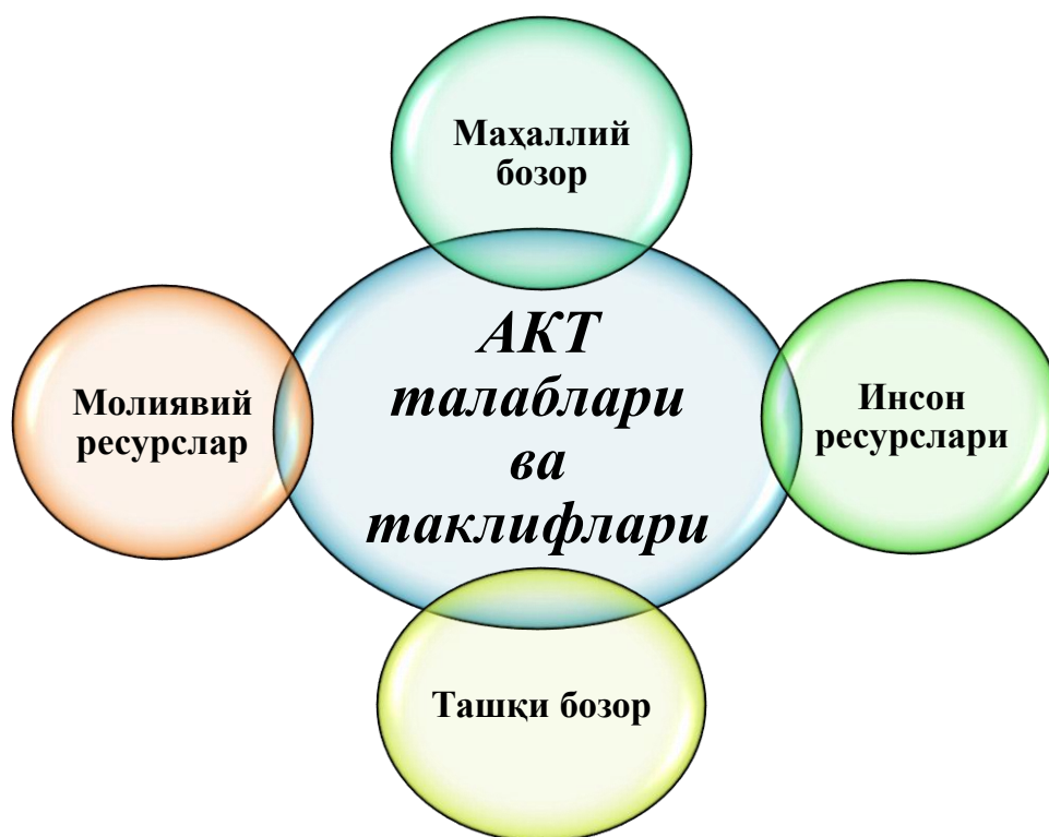
2-расм. АКТ талаб ва таклифига давлат таъсири тамойиллари 2

Ундан кўриниб турибдики, АКТ талаб ва таклифларини шакллантиришда маҳаллий бозор, молиявий ресурслар, инсон ресурслари ҳамда ташқи бозор омиллари асосий рол ўйнайди.