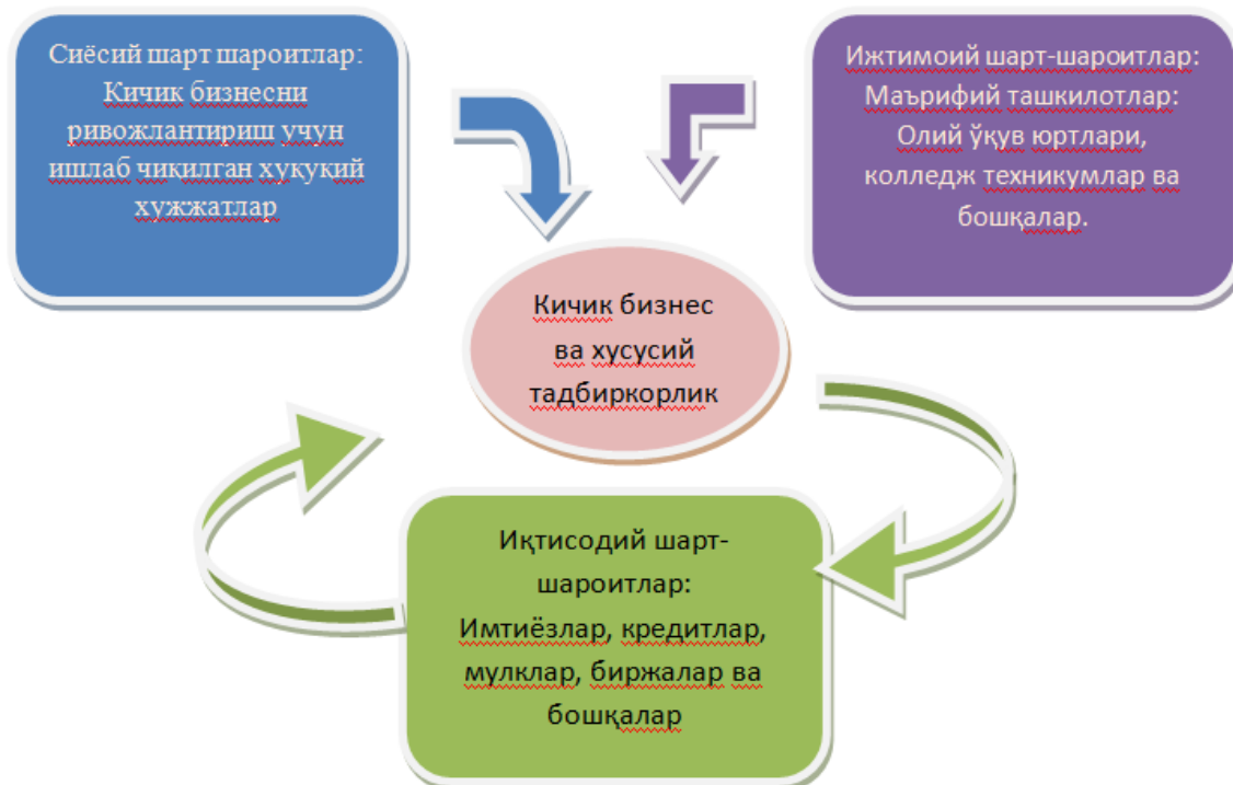
2-расм. Кичик бизнес ва хусусий тадбиркорлик ташкилий қисмлари.

Инфратузилмалар салоҳиятини ошириш айниқса пандемия шароитида жуда керак бўлди. Чунки пандемия биринчи бўлиб, кичик бизнесга зарар келтира бошлади. Кичик бизнес ва хусусий тадбиркорликка инфратузилмаларнинг таъсири ва самарадорлигини баҳолашда бизнес учун яратилган шарт-шароитларни йўналишлар бўйича таркибий қисмларга ажратиб ўрганиш асосида кўриб чиқиш мақсадга мувофиқ бўлади. Булар сиёсий, ижтимоий ва иқтисодий шарт шароитлар (2-расм).