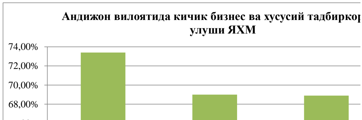
1-расм Андижон вилоятида кичик бизнес ва хусусий тадбиркорлик ўлуши ЯХМда [10].

Албатта Андижон вилояти ЯХМ даги улушини пандемия даврида айтиб ўтмоқ керак, сабаби охириги 3 йилда улуш камайиб борди. Бу монопол ва катта корхоналарнинг ривожланиш стратегиясини кучайиб бориши таъсирида пасайган, лекин бу борада ҳам кичик бизнесни улушини кўпайтириш учун кўшимча чора-тадбирлар амалга оширилди (1-расм).