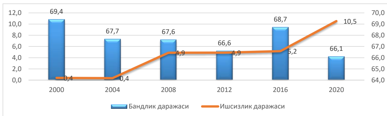
3-расм. Бандлик ва ишсизлик даражаларининг ўсиш суръати (банд аҳоли сонининг меҳнатга лаёқатли ёшдаги аҳоли сонига нисбатан, фоизда).

2021 йил январ ҳолатига кўра [18], мамлакатимизда меҳнат идораларидан рўйхатдан ўтган ишсизлар сони 37,1 минг кишини ташкил этган. Мазкур кўрсаткич 2010 йилга нисбатан қарийб 2,3 бараварга ошган бўлса, унинг ўсиш суръати 2000 йилда 0,4 фоиз, 2004 йилда 0,4 фоиз, 2008 йилда 4,9 фоиз, 2012 йилда 4,9 фоиз, 2016 йилда 5,2 фоиз ва 2020 йилда 110,5 фоизни ташкил этган (3-расм).