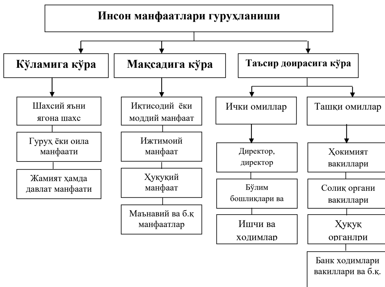
1-расм. Инсон манфаатлари гуруҳланиши.

Инсон манфаатлари тушунчасига бериладиган таъриф, иқтисодий нуқтаи назардан қараганда иқтисодий жараёнлар иштирокчилари бўлган инсонларнинг шахсий фазилатлари, хусусиятлари ва шу каби бошқа жиҳатларининг ташқи омиллар таъсири остида намоён бўлиши деб қарасак мақсадга мувофиқ бўлар эди (1-расм).