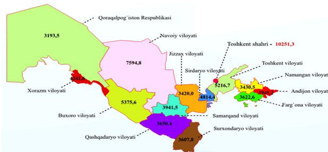
2-расм. Ҳудудлар бўйича аҳоли жон бошига умумий даромадлар миқдори (минг сўмда)

Аҳоли жон бошига йиллик нисбатан кўп даромад миқдори Тошкент шаҳри ва Бухоро, Тошкент, Сирдарё ва Хоразм вилоятлари ҳиссасига тўғри келса, аҳоли жон бошига йиллик энг кам даромад миқдори Қорақалпоғистон Республикасига (3193,5 минг сўм) тўғри келади [7].