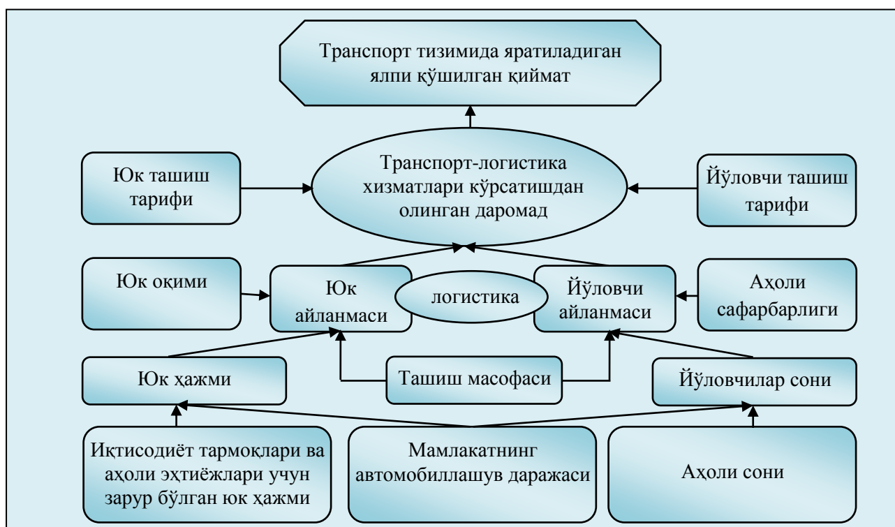
1-расм. Транспортда қўшилган қийматнинг шаклланиши.

Яратилган қўшилган қиймат транспорт-логистика хизматлари кўрсатишдан олинган даромаддан транспорт операторларининг оралик истеъмол учун бошқа ташкилотлардан харид қилган маҳсулот ва хизматларини айириб ташлаш орқали ҳисобланиши мумкин. Демак, унинг шаклланишига нафақат ташилган юк ёки йўловчилар ҳажми, балки ташиш баҳоси ва харажатлари ҳам муҳим рол ўйнайди.