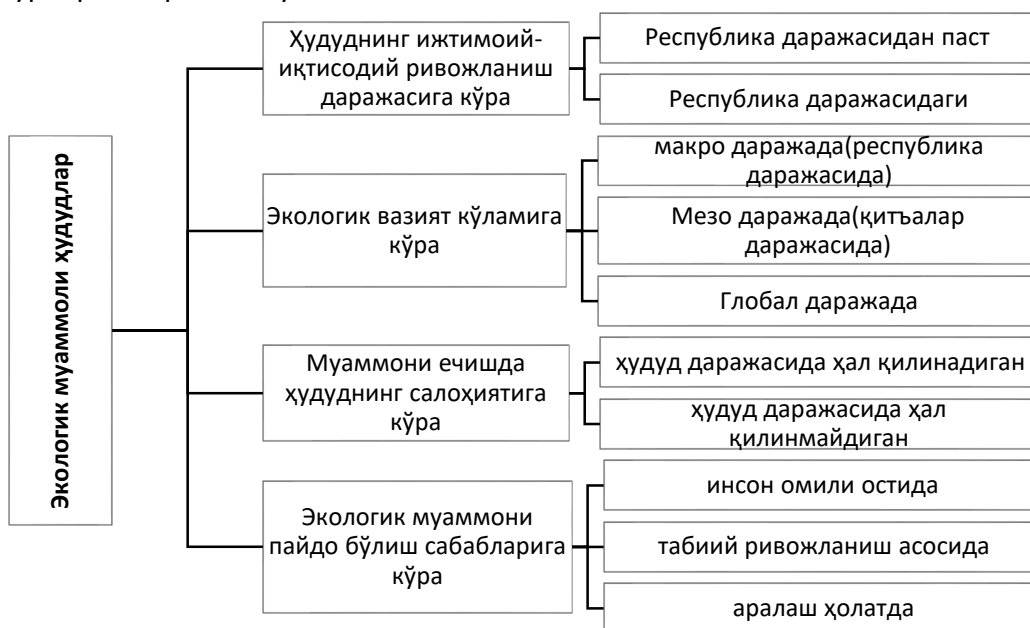
1-расм. Экологик ноқулай, муаммоли ҳудудларнинг таснифланиши

Экологик ноқулай ёки муаммоли ҳудудларни ҳам ўз хусусиятларига кўра бир неча турларга ажратиш мумкин: