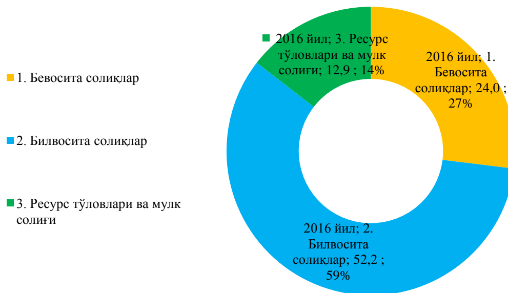
2-расм. 2016 йилда давлат бюджети даромадлари таркиби (умум. нисбатан % да)

2-расм маълумотларида Ўзбекистонда солиқ юки ҳамда давлат бюджети даромадлари таркиби бўйича: 2016 йилда билвосита солиқлар 59 фоизни, бевосита солиқлар 27 фоизни ҳамда ресурс тўловлари ва мулк солиғи 14 фоизни ташкил этган. Шунингдек, ушбу солиқларни шакллантирилишида оилавий тадбиркорлик фаолияти билан ҳам шуғулланувчи субъектларни улуши мавжуд. Бу кўрсаткич 2016 йилда давлат бюджети даромадларини 7,3 фоизи оилавий тадбиркорлик фаолиятига тўғри келади [7].