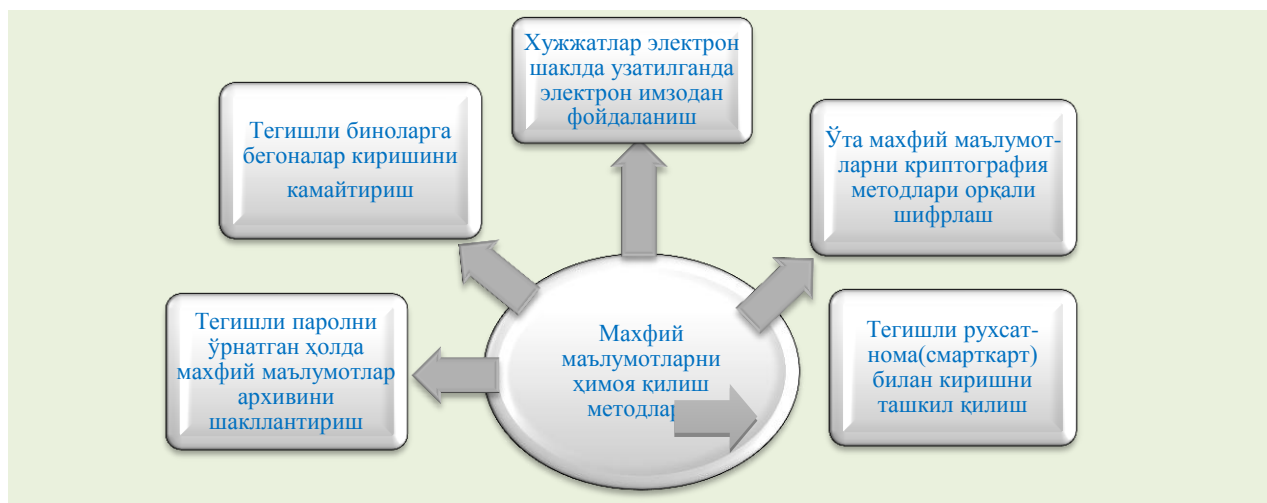
1-чизма. Махфий маълумотларни ҳимоя қилиш методлари.

Корхонада тижорат сирини режимини ташкил қилиш учун тегишли хужжатлар мажмуини ишлаб чиқиш ва бир қанча ташкилий тадбирларни амалга ошириш керак. Мазкур ташкилий тадбирлар 2-чизмада кўрсатиб ўтилган.