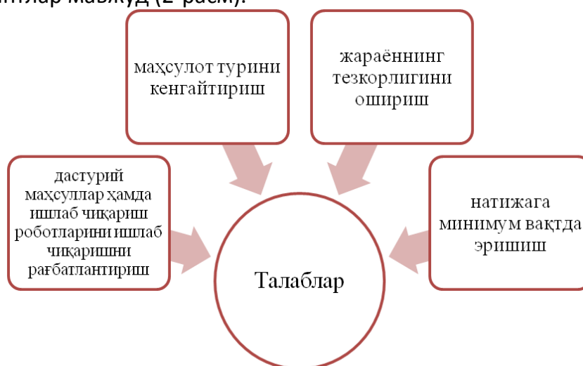
2-расм. Тадқиқот ишлари учун шаклланган грантларга талаблари [24]

Бундан ташқари, АҚШ ҳукумати 900 дан ортиқ инновациялар учун грантлар дастурини эълон қилган. Шулардан тадқиқот ишлари учун қуйидаги талаблар асосида шаклланган грантлар мавжуд (2-расм).