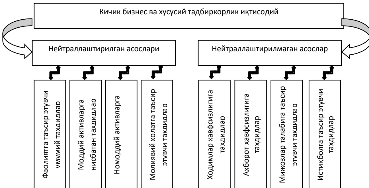
2-расм. Кичик бизнес ва хусусий тadbirkorlik иқтисодий хавфсизлигига таъсир этувчи тахдидлар таснифларининг асоси

Шуни таъкидлаш лозимки, иқтисодий хавфсизликка таъсир этувчи тахдидларни таснифлаш, биринчидан, бугунги кунда тахдидларни назарий асосга ва иккинчидан, амалий аҳамиятга эга эканлигини кўрсатади. Бу эса ўз навбатида тахдидлар кичик, ўрта ёки катта синфларга ажратиш имконини беради.