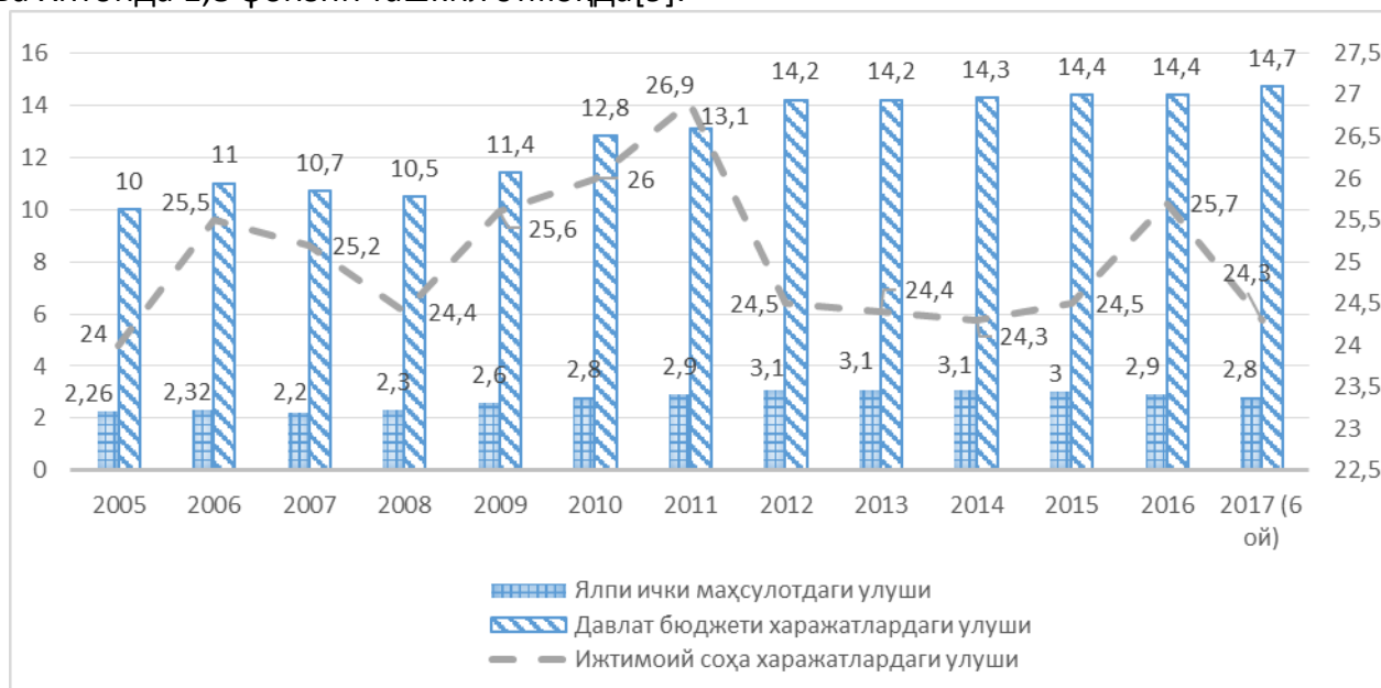
1-расм. Соғлиқни сақлаш вазирлиги тиббиёт муассасалари харажатлари динамикаси 7 , фоизда

Мамлакат ЯИМга нисбатан соғлиқни сақлаш тизими харажатлари Беларуссияда тўрт фоизни, Украинада 3,5 фоизни, Мексикада уч фоизни, Қозоғистонда 2,4 фоизни ва Хитойда 1,8 фоизни ташкил этмоқда[9].