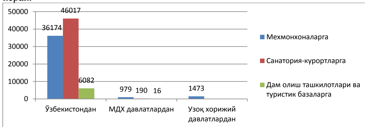
2-расм. 2015 йилда Наманган вилоятидаги рекреацион объектларга ташриф буюрувчиларни таркиби, киши

Дам олиш ташкилотлари ва туристик базаларда 2012 йилда 5,2 минг кишига, 2013 йилда 4,8 минг кишига, 2014 йилда 5,8 минг кишига, 2015 йилда 6,1 минг кишига кўпайган ҳолда ўтган йилларга нисбатан 0,9 минг кишига кўпайган. Вилоятдаги туристик фирма ва ташкилотларда 2012 йилда 3,1 минг кишига, 2013 йилда 2,5 минг кишига, 2014 йилда 0,4 минг кишига, 2015 йилда 0,6 минг кишига кўпайган ҳолда 2012 йилга нисбатан 2015 йилда 2,2 минг кишига камайган. Хулоса сифатида шуни айтиш мумкинки, вилоятдаги рекреацион объектлардаги таҳлилий маълумотларни ўрганиш асосида бир қатор объектларда рекреантларни келиши кўпайган, лекин туристик фирма ва ташкилотларга келувчилар сони анча камайган. Бу ҳолат рекреацион объектлардаги ижобий ўзгаришлар юз берганлигини кўрсатади. Вилоятга келувчилар сонини янада кўпайтириш учун рекреацион объектлар бўйича реклама ишларини янада кучайтириш, интернет тармоқларида кенг тарғибот ишларини олиб бориш зарур. Кўплаб ташкилотларда кенг тарғибот-ташвиқот ишларини ривожлантириш керак.