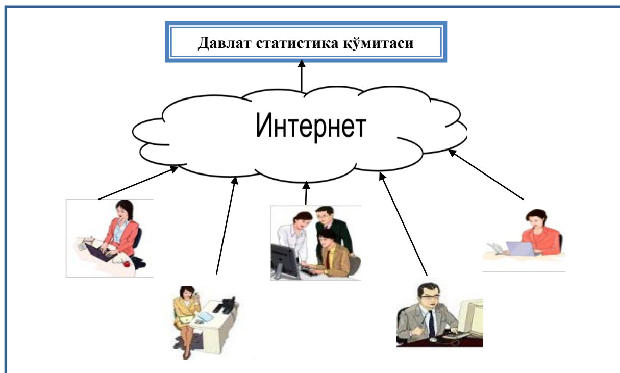
2-расм. Давлат статистика ҳисоботларини Интернет орқали юбориш

Интернетдан юборилади ва бу маълумот узатиш хафвсизлиги тўлиқ таъминлайди.