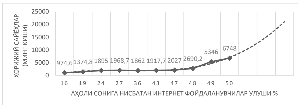
1-расм. Интернет фойдаланувчиларининг аҳоли сонига нисбатан улуши ва хорижий сайёҳлар сонининг ўсиш динамикаси (2010-2019 йиллар)

Манба: Туризмни ривожлантириш давлат қўмитаси ва Халқаро электр алоқаси иттифоқи маълумотлари асосида муаллиф ишланмаси