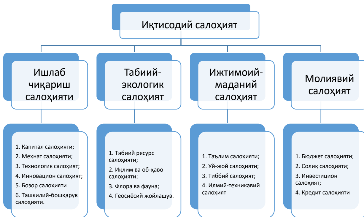
1-расм. Иқтисодий салоҳият таснифи 1

Микродаражада иқтисодий салоҳият таркиби корхона миқёсида аниқланадиган кўрсаткичлар орқали аниқланади. Жумладан, ушбу таркибга хусусий мулк, логистик, рақобат, ресурс, маркетинг, инновацион, сотиш бўйича корхонанинг мавжуд салоҳиятини киритиш мумкин. Мезодаражадаги таркиб минтақа иқтисодий салоҳиятини ифодаловчи кўрсаткичлар билан тавсифланади. Бу гуруҳ ўз таркибига табиий-ресурс, демографик, экологик, экспорт, инвестицион, институционал, бозор, таълим ва ижтимоий соҳа бўйича минтақанинг мавжуд салоҳиятини олади. Макродаражадаги таркиб бутун мамлакат учун тегишли бўлиб, ўз ичига мезодаражадаги таркиб билан бир қаторга иқтисодиёт тармоқлари иқтисодий салоҳиятини ҳам олади.