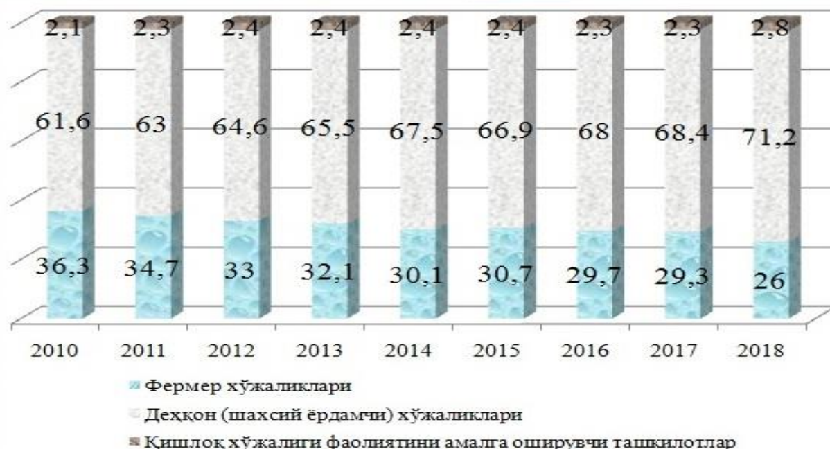
5-расм. Қишлоқ хўжалиги маҳсулотини ишлаб чиқаришнинг таркиби, фоизда.

2-жадвал орқали саноатнинг истеъмол товарлари ишлаб чиқариш соҳаларида ҳудудларнинг турлича улуши келтирилган. Унда 2018 йил якунига кўра мазкур соҳада етакчи ўринда, яъни 11 турдаги истеъмол товарларидан деярли 10 та кўрсаткичлар бўйича Тошкент шаҳри, кейинги ўринларда Тошкент ва Андижон вилоятлари мос равишда 6 ва 5 турдаги истеъмол товарлари ишлаб чиқариш бўйича юқори кўрсаткичларга эга.