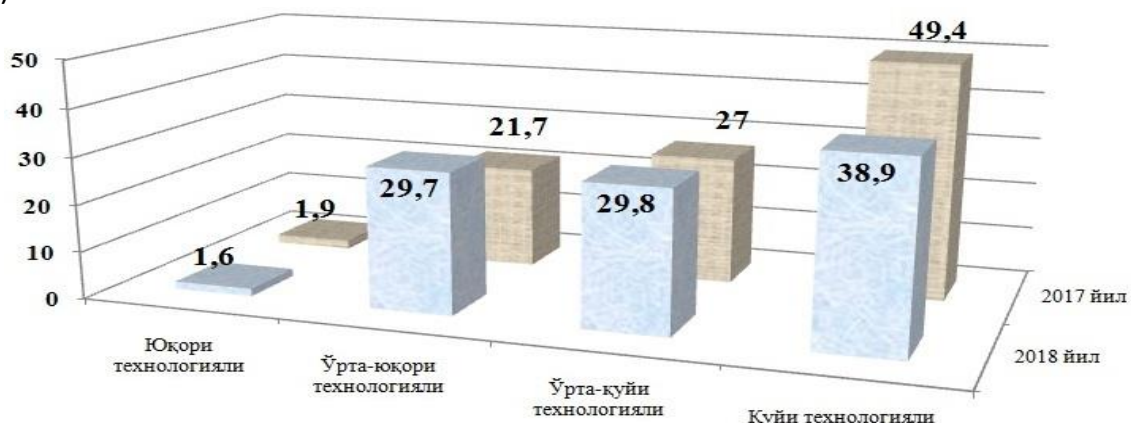
2-расм. 2017-2018 йилларда саноатда технологиялар замонавийлик даражаси, фоизда

Тармоқда технологиялар замонавийлик даражаси бўйича ҳам тафовутлар мавжуд. Яъни ишлаб чиқарадиган саноат таркибида юқори технологияли тармоғининг улуши 2018 йилда 1,6 % ни (2017 йил январь-декабрь ойларида – 1,9 %), ўрта юқори технологияли – 29,7 (21,7 %), ўрта-қуйи технологияли – 29,8 % (27,0 %), шунингдек, қуйи технологияли тармоқлар улуши – 38,9 % (49,4 %) ташкил этди (2-расм).