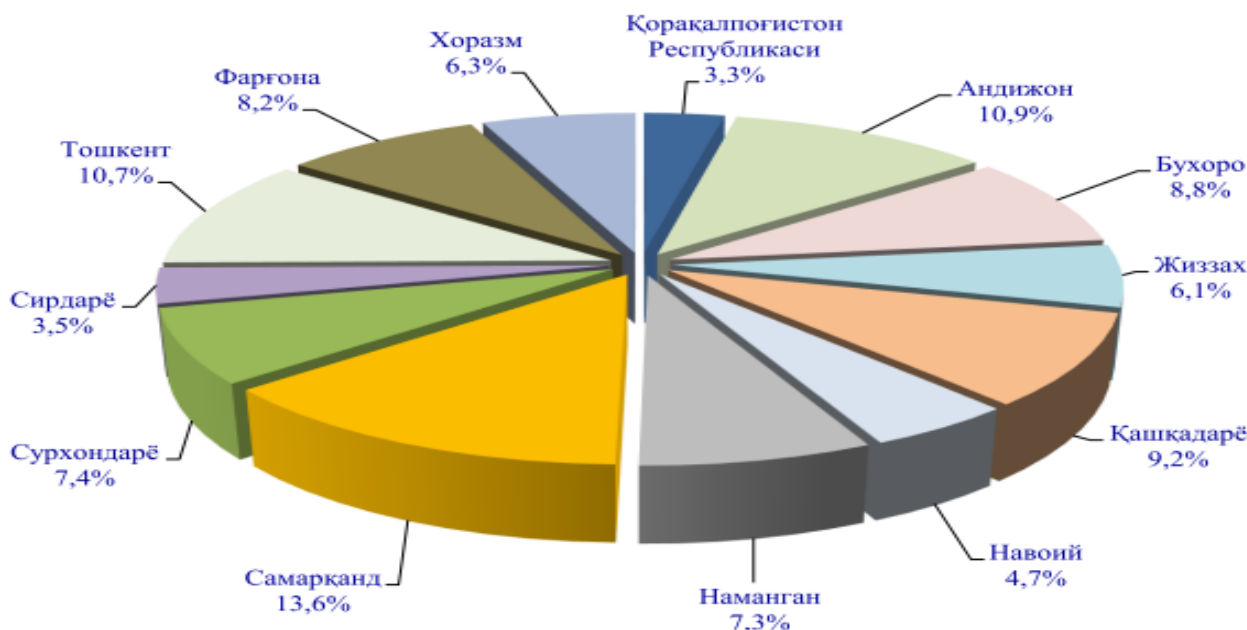
3-4-расмлар. Худудларнинг республика жами sanoat ishlab chiqarish ҳамда қишлоқ, ўрмон ва балиқ хўжалиги маҳсулот (хизматлар) умумий ҳажмида худудларнинг улуши улуши (2018 йил).