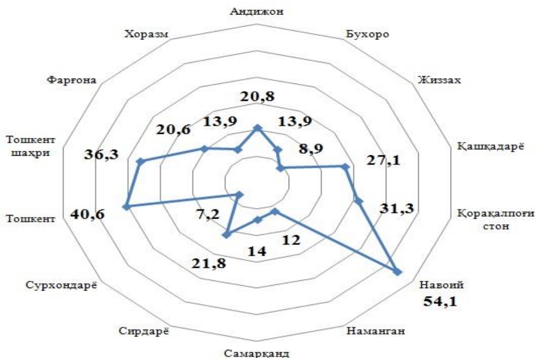
1-расм. 2019 йил 1 январь ҳолатига вилоятлар ЯХМ таркибида саноатнинг улуши, фоизда

таркибида саноатнинг улуши жорий йилда 35 фоиздан 37 фоизга ортиши кутилмоқда. Бироқ айрим шаҳар ва туманларда бу ўта муҳим масалага етарлича эътибор берилмаётгани учун республиканинг 27 та туманида саноатнинг улуши вилоят кўрсаткичининг 1 фоизидан ҳам паст...”[11]лиги, аҳоли жон бошига саноат маҳсулотининг турли ҳудудларда кескин фарқ қилиши, умуман жаҳондаги “Катта йигирматалик” ва Европа Иттифоқи давлатлари ялпи ички маҳсулотида саноат умумий ўртача салмоғи кўриб чиқилганда, 27,3 фоиз[12]ни ташкил қилган бўлсада, аҳоли жон бошига ишлаб чиқарилган саноат маҳсулоти мазкур давлатларда бизга нисбатан ўнлаб марта юқори кўрсаткични ифодалаётгани, соҳада олиб борилаётган чора-тадбирлар натижадорлигини янада кучайтиришни талаб қилади.