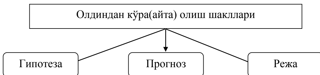
1-расм. Олдиндан кўра(айта) олиш шакллари 1 .

Табиат ва жамиятда юз берадиган табиий ва ижтимоий-иқтисодий жараён(ҳодиса, воқеълик)ларнинг ривожланиш хусусиятлари ва уларнинг келгусидаги ҳолатини аниқлашнинг шакллари сифатида илмий жамоатчилик ўртасида башорат, гипотеза, прогноз ва режа каби шакллари тан олинади. Жараёнларни олдиндан кўра(айта) олишнинг ушбу шакллари илмий-тадқиқот методологиясида ҳам муҳим ўрин тутди.