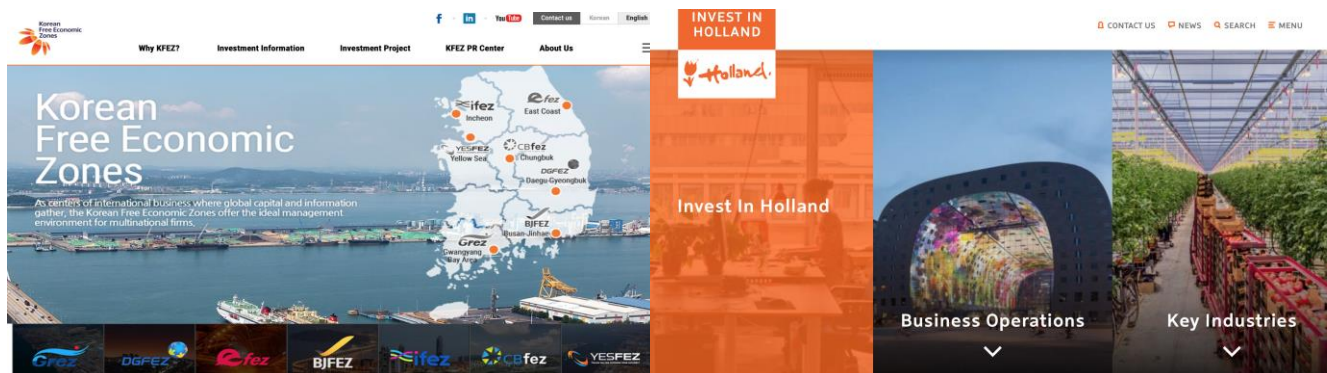
3-расм. Fez.go.kr сайтининг кўриниши

Энди Голландия ва Кореядаги инвестицияларни жалб қилишга мўлжалланган сайтларни таҳлил қилиб чиқамиз.