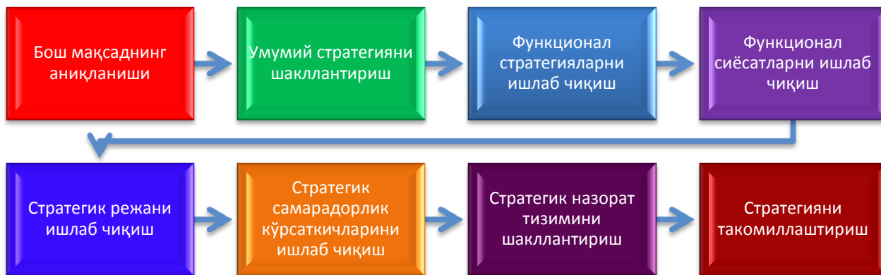
1-расм. Тижорат банки фаолиятини ривожлантириш стратегиясининг таркибий элементлари тузилмаси 4

Фикримизча, тижорат банклари фаолиятини ривожлантириш стратегияси элементларини қуйидаги расм орқали ифодалаш мумкин: