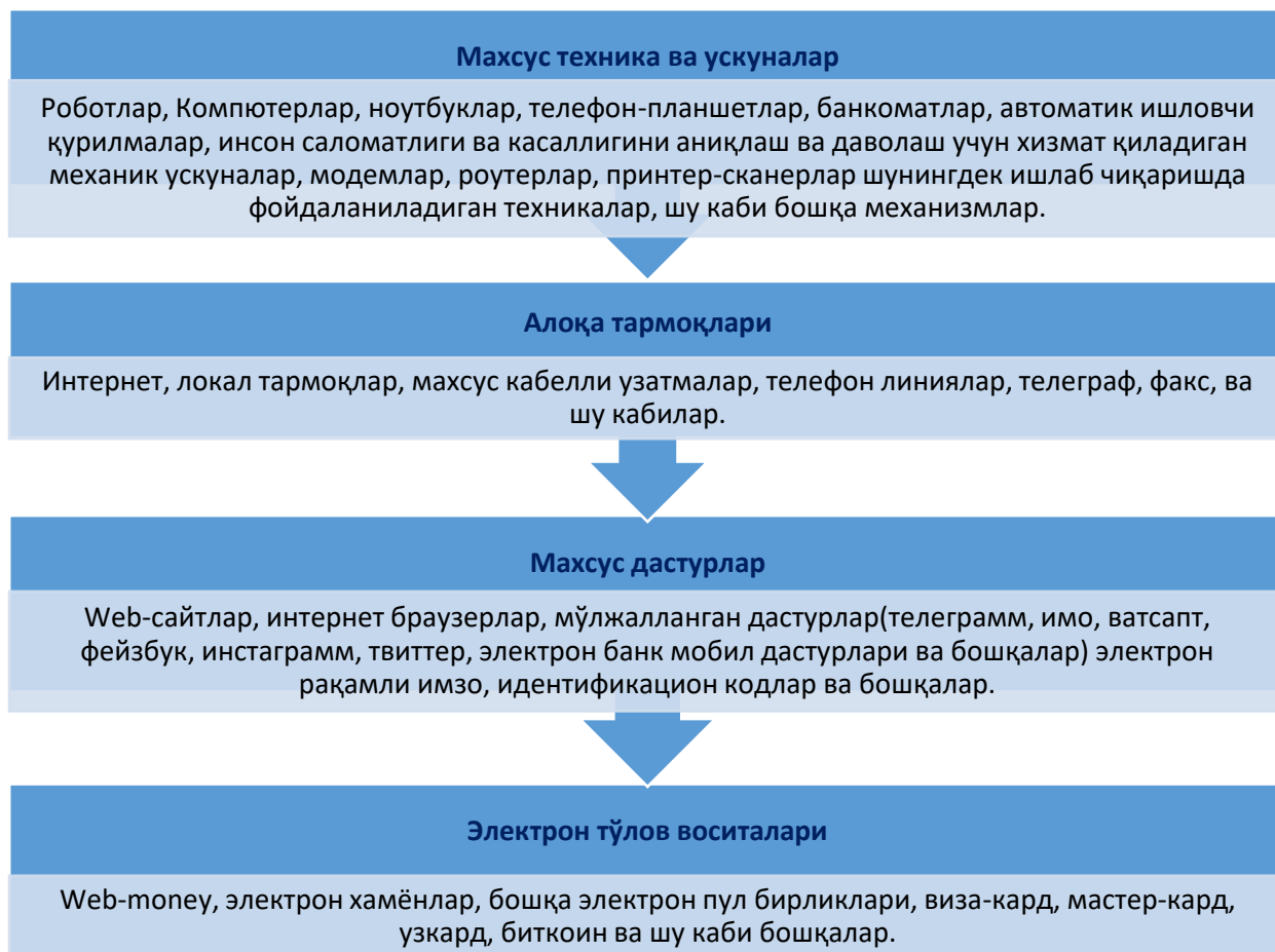
2-расм. Рақамли хизматларни шакллантирувчи асосий воситалар

Рақамли хизматларнинг асосий қулайликларидан бири мамлакатнинг чекка ҳудудларигача хизмат имкониятининг мавжудлиги бўлиб, бундай рақамли хизматлар қўйидаги воситалар орқали амалга оширилади: