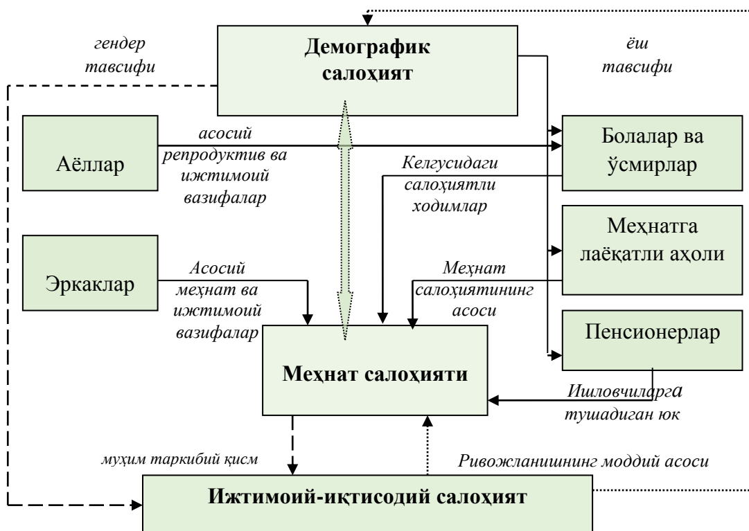
1-расм. Демографик салоҳиятнинг таркиби

Шундан келиб чиқиб, демографик салоҳиятнинг таркибини куйидаги тарзда тақдим этиш тавсия этилади (1-расм).