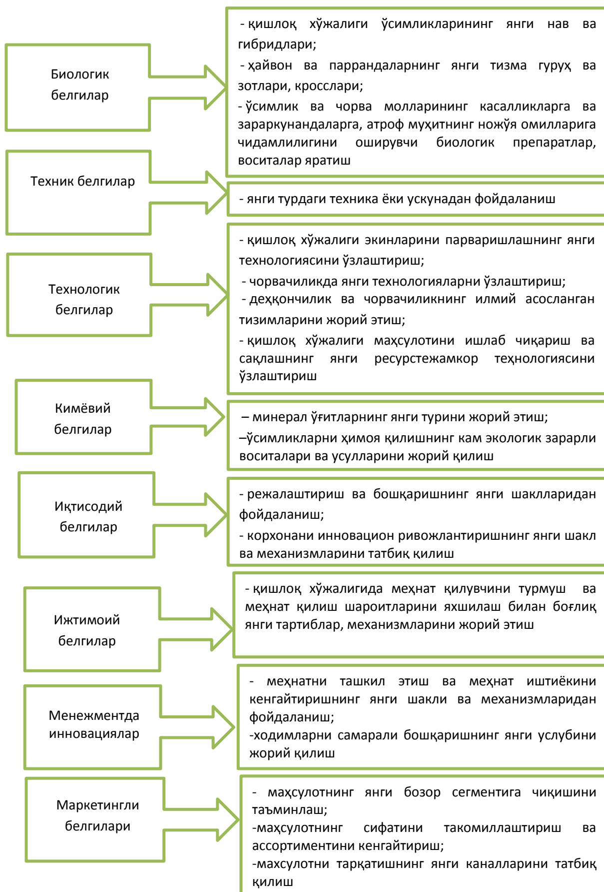
2-расм. Инновацияларни қишлоқ хўжалигида қўлланилиш соҳаси бўйича таснифлаш 2