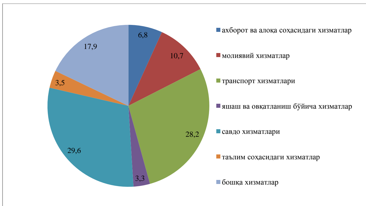
2-расм. Ўзбекистон хизматлар бозорида хизматларнинг таркиби (2016 йил, фоизда) [9]

Ушбу 1-2 расмларда келтирилгандек, 2010-2016 йилларда транспорт хизматларининг улуши 36,2 фоиздан 28,2 фоизга, алоқа ва ахборотлаштириш хизматлари 8,0 фоиздан 6,8 фоизга камайди. Шу билан бирга, савдо хизматларининг улуши 25,4 фоиздан 29,6 фоизга, молиявий хизматлар улуши 10,2 фоиздан 10,7 фоизга, таълим соҳасидаги хизматлар 2,9 фоиздан 3,5 фоизга, яшаш ва овқатланиш хизматлари 1,1 фоиздан 3,3 фоизга, кўчмас мулк билан боғлиқ хизматлар 3,1 фоиздан 3,7 фоизга кўпайди [9]. Компьютерлар ва маиший товарларни таъмирлаш бўйича хизматлар, меъморчилик, муҳандислик изланишлари, техник синовлар, таҳлил соҳасидаги хизматлар ва бошқа хизматларнинг жами хизматлар ҳажмидаги улуши ўзгаришсиз қолди.