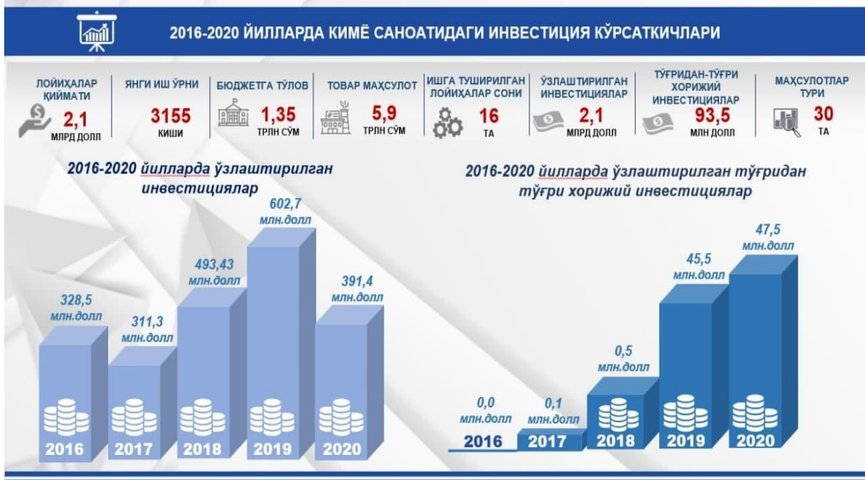
2-расм. 2016-2020 йилларда кимё саноатидаги асосий инвестиция кўрсаткичлари 1

Ўзбекистондаги кимё саноати корхоналарига 2016-2020 йилларда 2,1 млрд. долларга тенг қийматли лойиҳалар амалга оширилган. Бунинг натижасида 3155 та янги иш ўрни яратиш имконияти яратилди. Лойиҳалар ишга туширилиши натижасида жами 1,35 трлн. сўм бюджетга йўналтирилган.