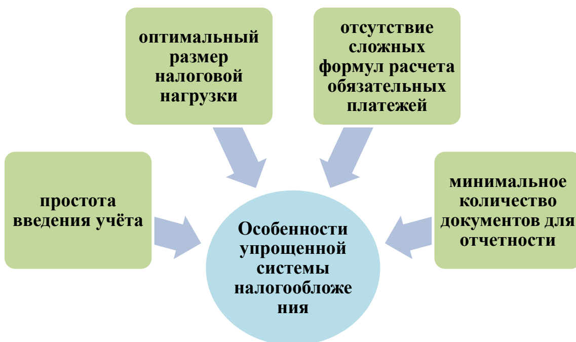
Рис. 1. Особенности упрощенной системы налогообложения Источник: Рисунок составлен на основе изученного материала]

Установление упрощенных (в широком смысле) систем налогообложения приводит к снижению издержек для налогоплательщика, а также соответствующих административных издержек по проверке применяющих такие методы налогоплательщиков.