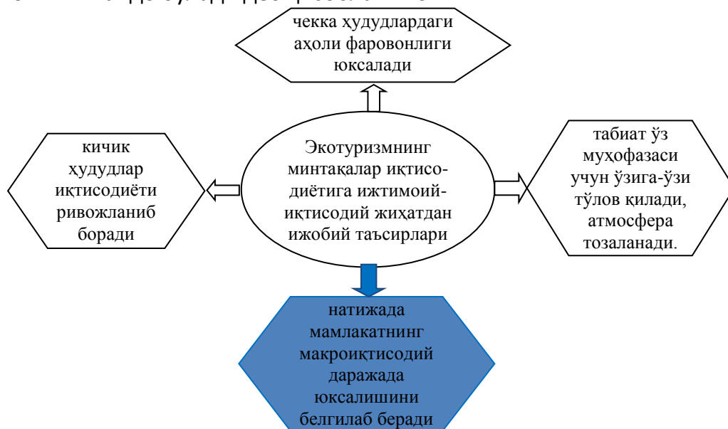
3-расм. Экотуризмнинг жамиятга ижтимоий-иқтисодий жиҳатдан ижобий таъсирлари

Шуни хулоса қилиб айтиш мумкинки, юқоридаги мавжуд салоҳият ва манбаалардан тўлақонли фойдаланилса ва амалиётга жорий этилса, аҳолининг дам олиш, туристик экскурсия каби хизматларини йўлга қўйиш орқали Ўзбекистонда янги иш ўринлари яратиш ва қўшимча маблағ тўплаш имкониятлари юзага келиб, мамлакат ҳудудий маҳсулот ишлаб чиқаришда хизматлар соҳасининг улушини янада ошириш имконияти пайдо бўлади деб ҳисоблаймиз.