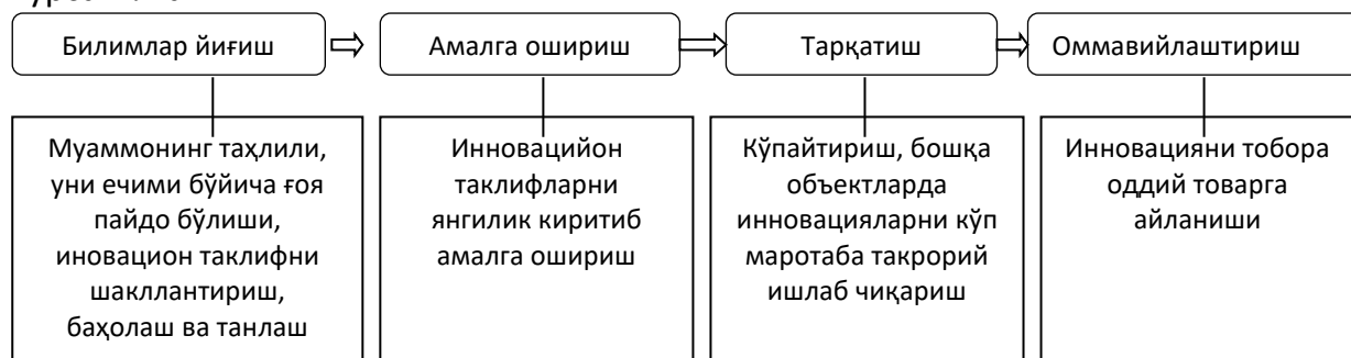
2- расм. Инновациянинг ҳаёт циклининг асосий таркибий қисмлари [5]

Янгиликдан фарқли ўлароқ, инновация – бу иқтисодий самара олиш учун янгиликларни амалда қўллашдан иборат бўлган ҳодисадир. 2-расмда инновацияларни ҳаёт циклининг асосий таркибий қисмлари кўрсатилган.