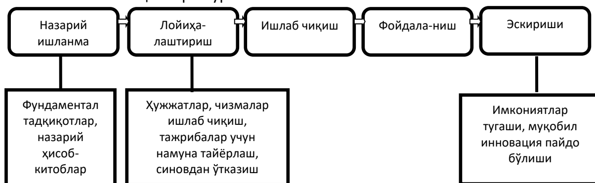
1-расм. Янгиликнинг намунавий ҳаёт циклининг асосий босқичлари [3]

Янгилик - бу интеллектуал фаолият натижасидир; бу янги стратегия, бизнеснинг янги модели, янги ташкилий тузилма, янги маркетинг усули, янги жараён, янги технология, янги маҳсулот ёки уларнинг маълум бирикмаси. 1-расмда янгилик ҳаёт циклининг асосий босқичлари кўрсатилган.