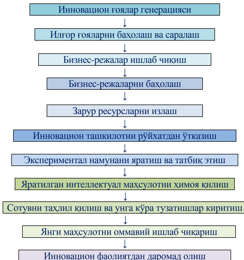
2-расм. Инновацион тадбиркорлик босқичлари

Инновацион тадбиркорлик тадбиркорликнинг алоҳида тури бўлганлиги сабабли, унинг учун бу тўрт босқични янада бўлақларга бўлиш лозим (2-расм).