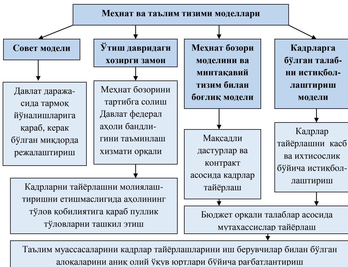
2-расм. Meънат ва таълим тизимлари модели