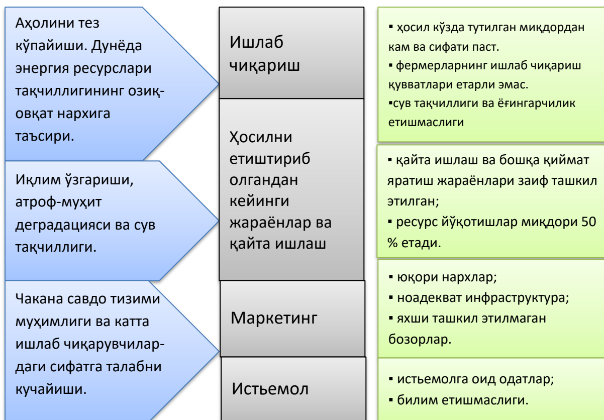
2-расм. Озиқ – овқат саноатида қиймат занжирини бошқариш учун заруратни келтириб чиқарувчи омиллар

Юқорида келтирилган 2-расмдаги маълумотлардан кўриниб турибдики, озиқ-овқат саноатида қиймат занжири хом-ашё тайёрлаш учун экин экишдан бошланади ва тайёр маҳсулотни чакана савдоси билан тугайди. Ушбу жараёнга хом-ашё тайёрлашгача бўлган босқич, яъни қишлоқ хўжалик экинини етиштириш жараёнини қўшилиши жиддий аҳамиятга эга. Чунки, йўқотишларнинг катта қисми ушбу босқичда юз беради, хом-ашё сифати маҳсулоти сифатига тўғридан-тўғри кучли таъсир кўрсатади. Қайта ишлаш саноати вакиллари муваффақияти таъминотчиларнинг ишни қандай ташкил қилишга кучли боғлиқ бўлади. Истъемолчиларнинг якуний маҳсулотдан оладиган нафи ёки йўқотишлари эса тайёр маҳсулот ишлаб чиқарувчиларнинг иқтисодий самардорлик даражасидан келиб чиқиб, шаклланади.