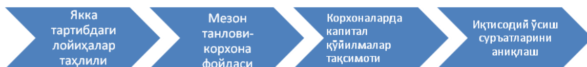
2-расм. Микроёндашувнинг қатъий схемаси[13].

Мазкур концепцияни “меҳнат таклифининг ортикчалиги модели” деб номланишига сабаб профессор У.А. Льюис меҳнат ресурсларининг чекланмаганлиги гипотезасини илгари суриб, малакасиз ишчи кучи учун яшаш минимумини қондириш учун иш ҳақи тўланиши етарли деб биледи. Тараққий этган мамлакатларнинг замонавий бозор иқтисодиётида эса реал иш ҳақи бозордаги меҳнат ресурсларига бўлган талаб ва таклифдан келиб чиқиб аниқланади. У.А. Льюис ривожланаётган мамлакатларда меҳнат таклифи ҳар доим ортикча бўлганлиги сабабли аҳоли жон бошига тўғри келадиган иш ҳақининг мавжуд даражасини доимий деб олиш мумкин деб ҳисоблайди. Шу тариқа ривожланаётган мамлакатлардаги дуализм концепцияси асосида турли хил тақсимот қонунлари амал қилади. Саноат тармоғида ҳал қилувчи омил бозор бўлганлиги сабабли ишлаб чиқариш имкониятлари чегараси қонуни ишлаб чиқарилган маҳсулот учун тўланган реал иш ҳақидан келиб чиқади. Аграр тармоқда эса асосий омил маҳаллий институтлар ҳисобланиб, улар томонидан ўртача иш ҳақи белгилаб берилади.