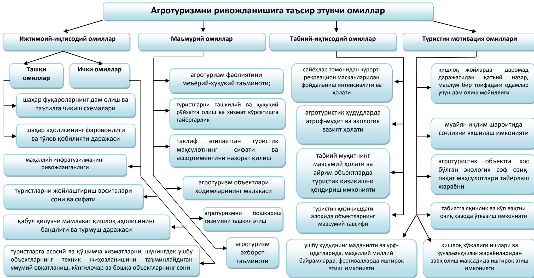
3-расм. Агротуризмни ривожлантириш омиллари таснифи 1