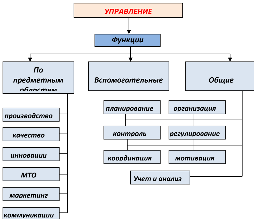
Рис 1. Функции управления

Из определения «управления» следует, что в системе субъект оказывает воздействие на объект, а способ воздействия - метод, который является третьим критерием (рис.2).