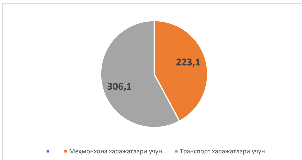
1-расм. 2021-2022 йиллар давомида туроператор ва турагентлар томонидан маҳаллий саёҳатларни ташкил этилганлиги учун ажратилган субсидиялар миқдори 1 (млн.сўм)

Хусусан, 2021 йил февраль ойида йўлга қўйилган “Урганч-Фарғона-Урганч” авиайўналишининг биринчи ойида самолётларнинг бандлиги 43,7 фоизни ташкил этган бўлса, туроператор ва турагентларга яратилган қўшимча имконият натижасида самолётлар бандлиги март ойида 87,9 фоизга яъни икки баробарга ошди.