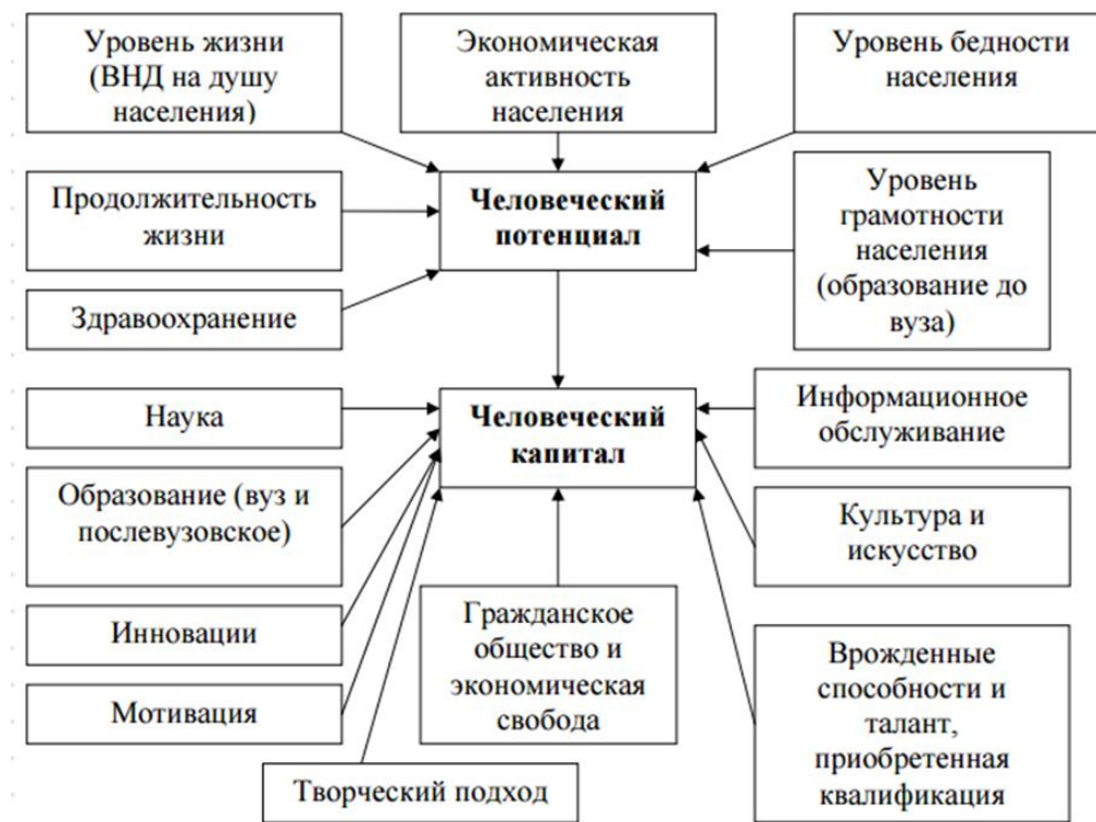
Рисунок 3. Человеческий потенциал и человеческий капитал 3

Исходя из представленного рисунка можно сказать, что человеческий потенциал, являясь значимым направлением в области определения и оценки эффективности экономики современного типа, играет решающую роль в конкурентоспособности страны, которая определяется не только общим уровнем производства и потребления, но и ее технологическим и инновационным развитием.