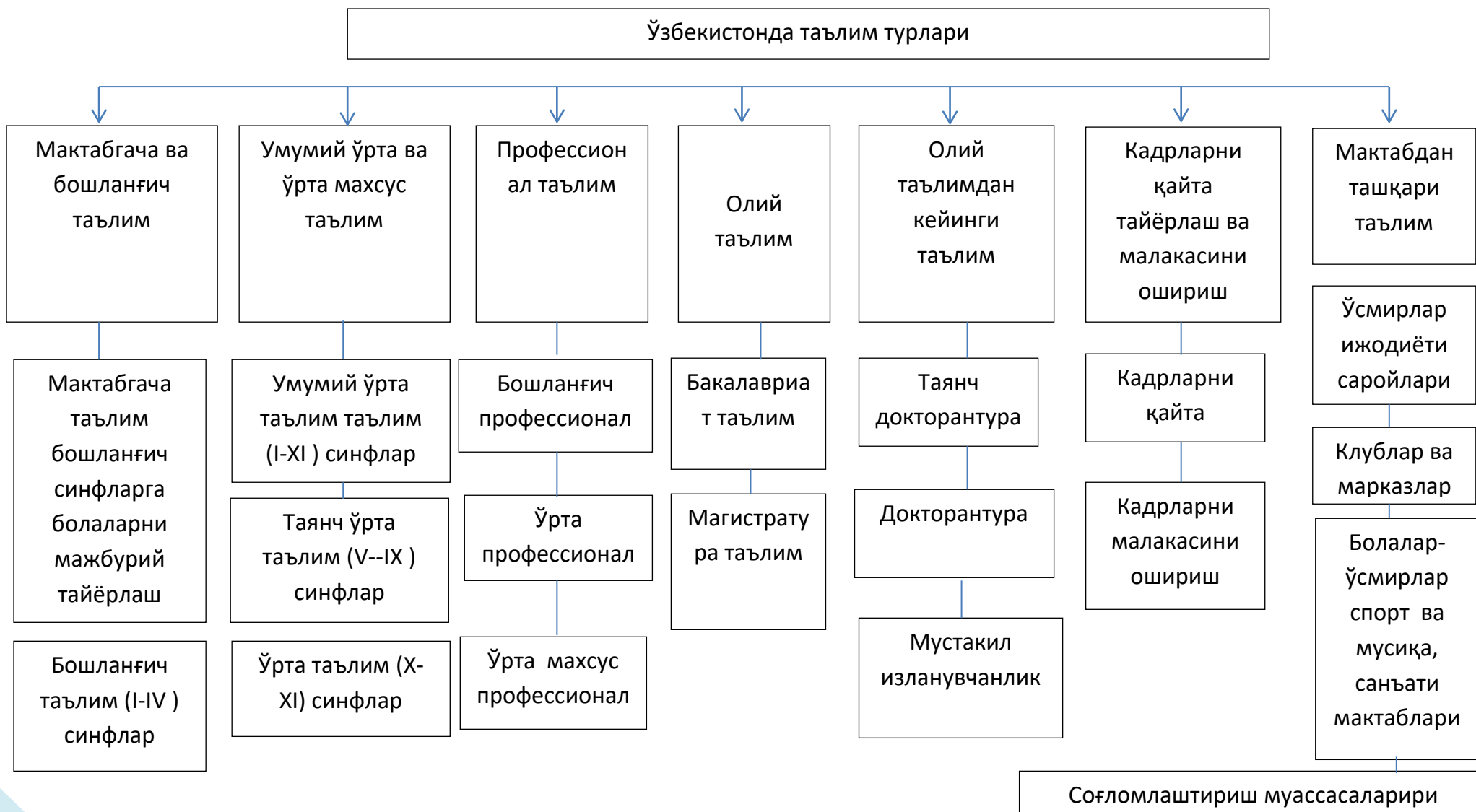
2-чизма. Ўзбекистонда янги таълим турлари бўйича таснифи. Муаллиф ишланмаси.