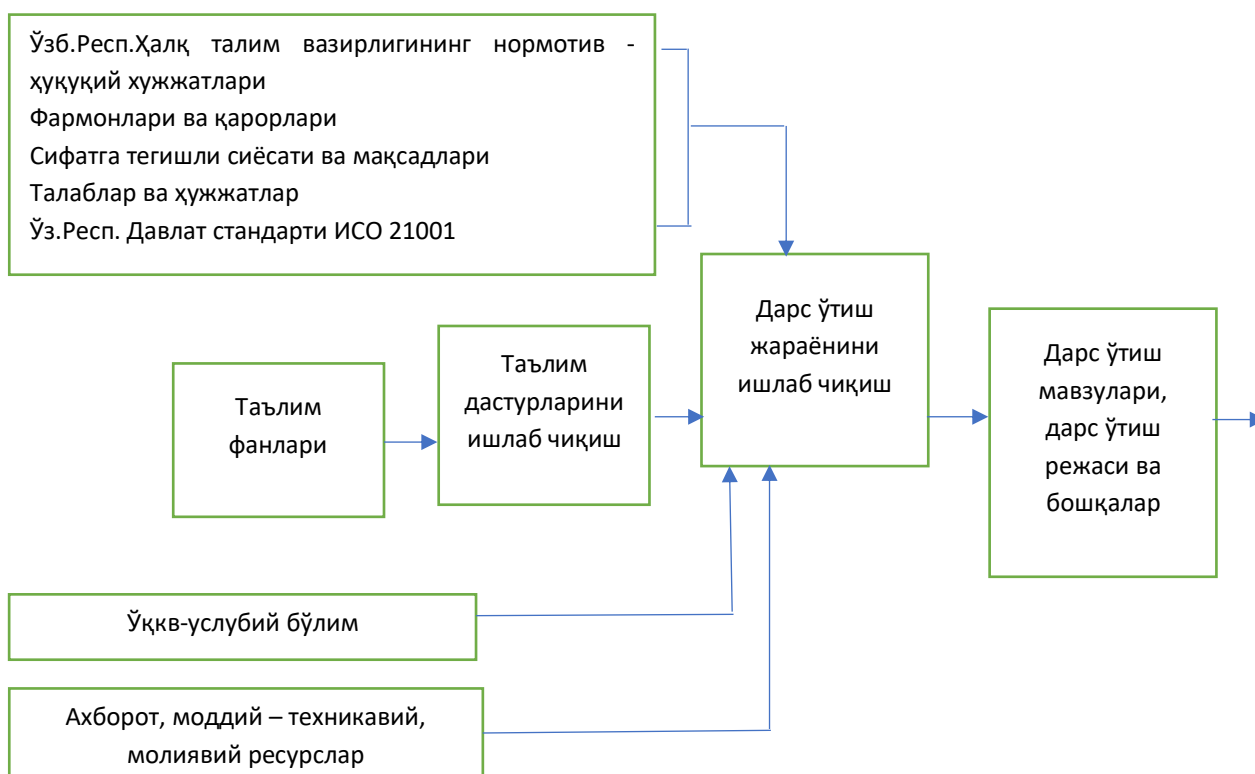
2 - расм. Ўрта таълимда ўқув-услубий фаолиятни лойиҳалаш жараёнининг функционал моделининг иккинчи босқичи 2

Шундай қилиб, ўрта таълим муассасаси томонидан амалга ошириладиган таълим дастурларини ўқув-услубий таъминлашнинг роли норматив равишда ўрта таълим битирувчиларини тайёрлаш мазмуни ва сифатини белгиловчи ажралмас шарт сифатида белгиланади.