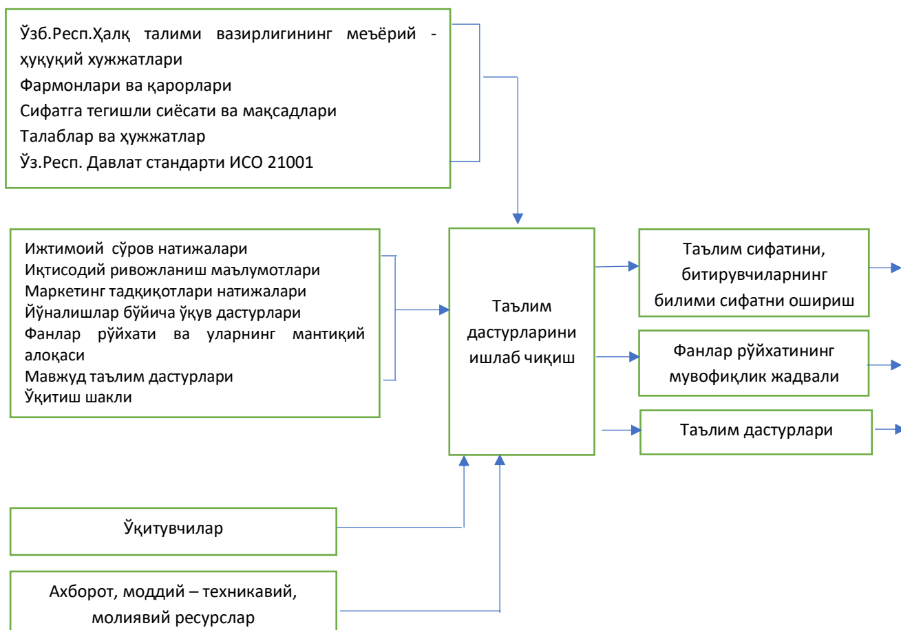
1-расм. Ўрта таълимда ўқув-услубий фаолиятни лойиҳалаш жараёнининг функционал моделининг биринчи босқичи 1

Фикримизча, мазкур вазифани амалга оширишда ўрта таълим фаолиятини лойиҳалаш жараёнининг функционал моделини ишлаб чиқишимиз зарур, деб ҳисоблаймиз. (1-, 2- 3-расмлар.)