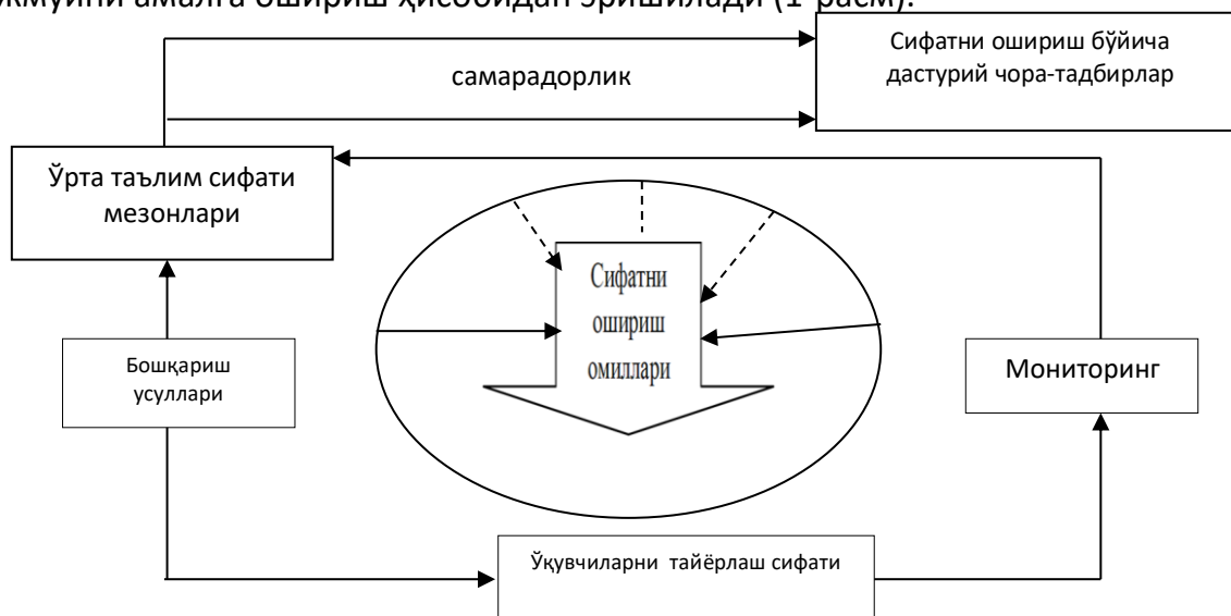
1-расм. Ўрта таълим тизимида ўқувчиларни тайёрлаш сифатини бошқариш механизми

шароитларга бевосита ёки билвосита таъсир кўрсатувчи дастурий тадбирлар мажмуини амалга ошириш ҳисобидан эришилади (1-расм).