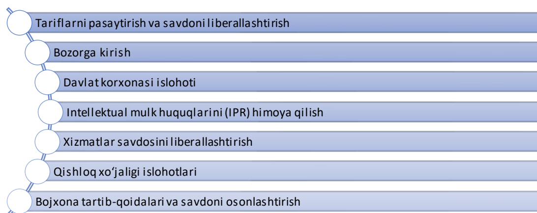
1-rasm. Xitoy tomonidan amalga oshirilgan asosiy islohotlar 3 .

Xitoy Xalq Respublikasi o‘zining savdo-iqtisodiy siyosatini Jahon Savdo Tashkiloti (JST) talablariga muvofiqlashtirish va unga a‘zo bo‘lishini osonlashtirish maqsadida turli sohalarda keng ko‘lamli islohotlarni amalga oshirdi. Ushbu islohotlar Xitoy bozorlarini ochish, savdo to‘siqlarini kamaytirish, shaffoflikni oshirish, JST qoidalarini va tamoyillariga rioya qilishni ta‘minlashga qaratilgan edi.