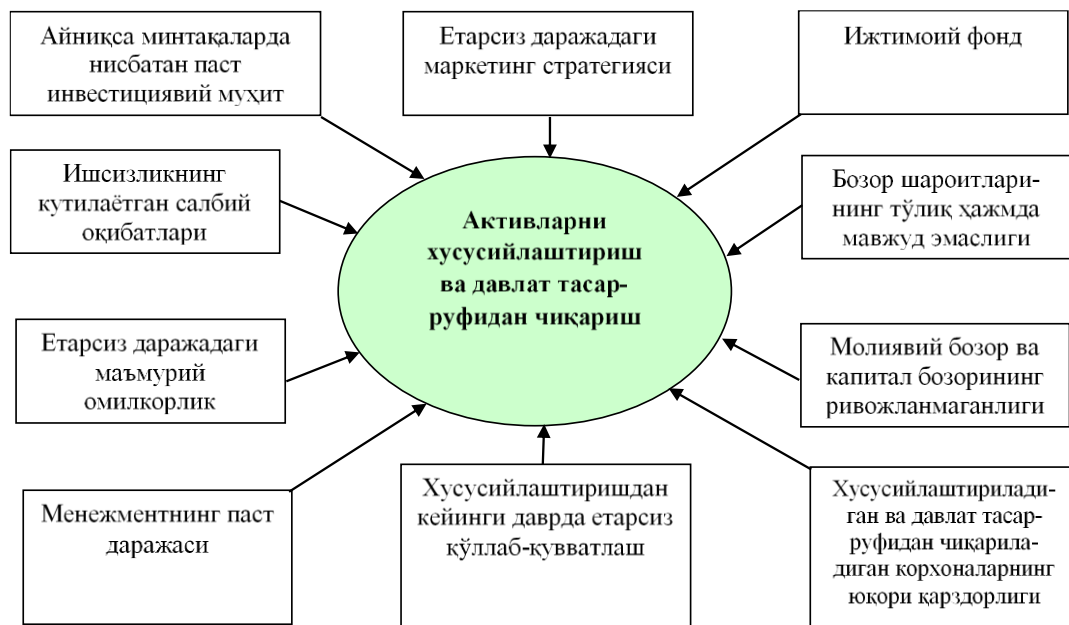
2-расм. Баҳолаш фаолиятини ривожлантиришда ҳисобга олиниши лозим бўлган хусусийлаштириш жараёнидаги тўсиқлар

Бунда баҳолаш фаолиятининг ривожланишига асосий фондларни хусусийлаштириш ва давлат тасарруфидан чиқариш жараёнида юзага келадиган тўсиқлар катта таъсир кўрсатади. Уларнинг асосийлари 2-расмда акс эттирилган.