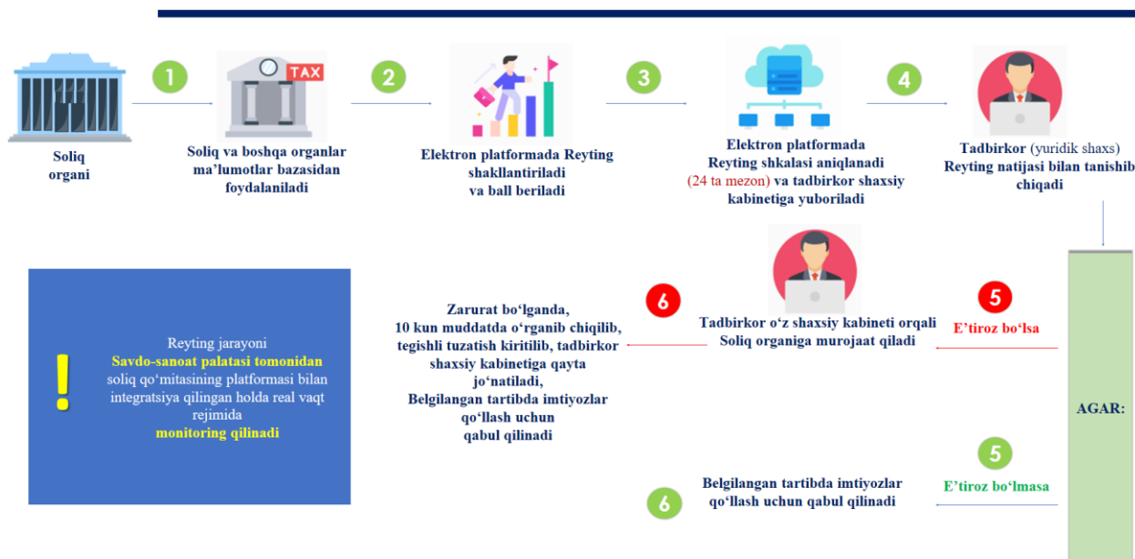
3-rasm. Tadbirkorlik subyektlarining barqarorlik reytingini aniqlash mexanizmi [12]

Bunda tadbirkorlik subyektlari faoliyati davomida o'zining bozordagi (shaxsiy brend) o'rnini “Tadbirkorlik subyektlarining barqarorlik reytingi” elektron platformasi orqali kuzatib