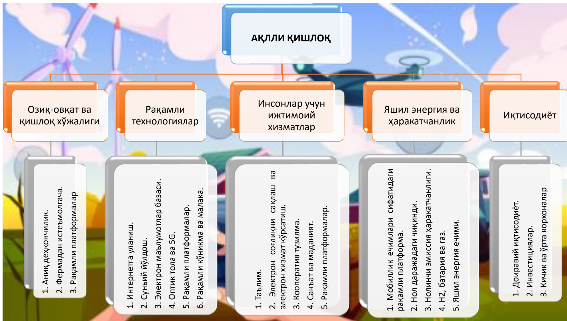
2-расм. Ақлли қишлоқни ривожлантириш йўналишлари 15 .