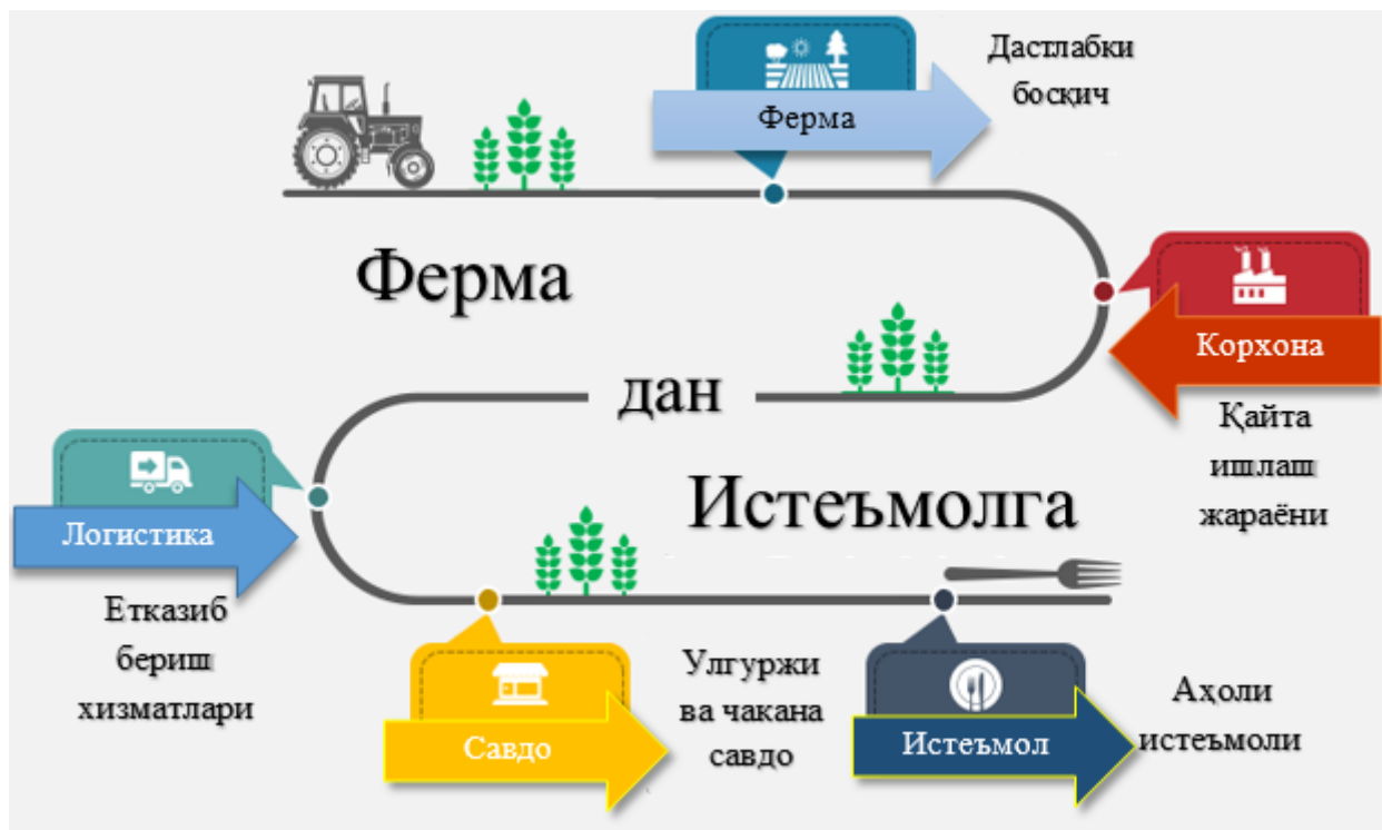
3-расм. Фермер хўжаликларида етиштирилган маҳсулотларнинг истеъмолга йўналиш механизми 13 .

Биринчи йўналишда, озиқ-овқат ва қишлоқ хўжалиги маҳсулотларини табиий етиштириш учун аграр соҳада ақлли технологияларни қўллаш аграр муаммоларнинг самарали ечими сифатида қаралади ва ушбу йўналишнинг ўзини уч пунктга ажратади: