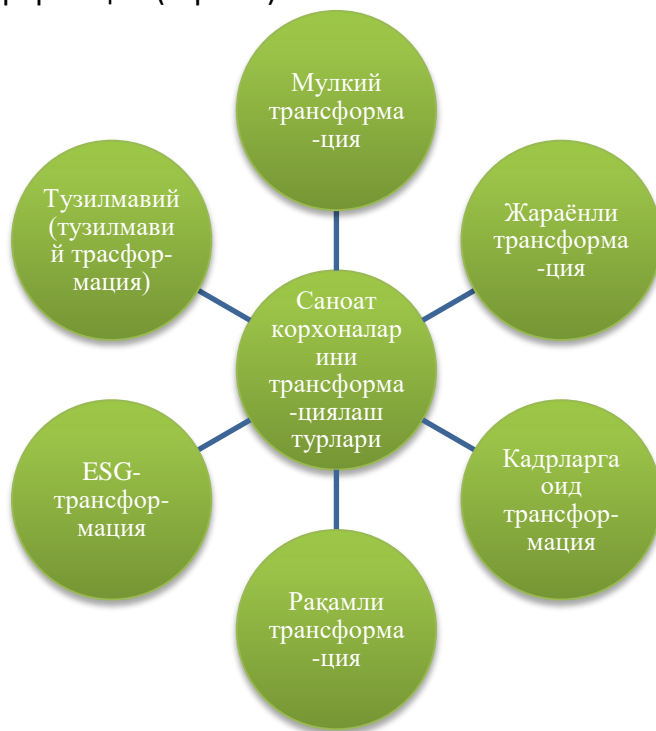
1- Расм. Саноат корхоналарини трансформациялаш турлари