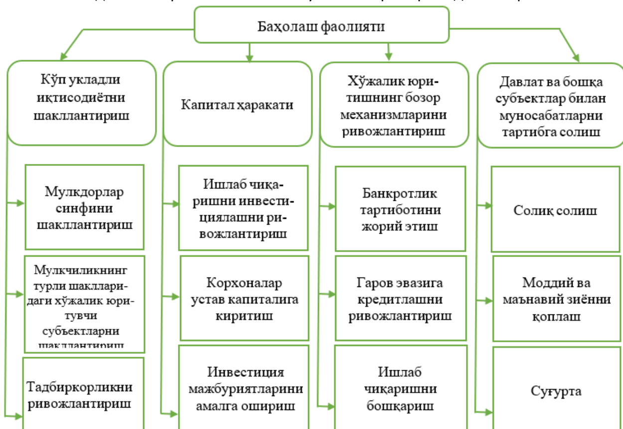
1-расм. Баҳолаш фаолиятининг бозор иқтисодиётининг шаклланиши ва ривожланишидаги иштирокининг асосий йўналишлари

Замонавий баҳолаш фаолияти бозор муносабатларини ва кўп укладли иқтисодиётни ривожлантириш, хўжалик юретишнинг бозор механизмларини такомиллаштириш, капитал ҳаракати ва бозорларнинг очиқлиги, хўжалик юритувчи субъектларнинг давлат билан ўзаро муносабатларини тартибга солишнинг зарур шarti ҳисобланади. Баҳолаш фаолиятининг бозор иқтисодиётининг шаклланиши ва ривожланишидаги иштирокининг асосий йўналишлари 1-расмда келтирилган.