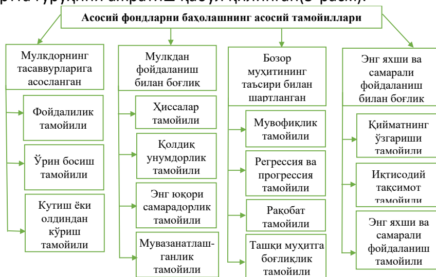
5-расм. Баҳолаш фаолиятини тартибга солишда ҳисобга олиниши лозим бўлган асосий баҳолаш тамойиллари

Баҳолаш фаолиятини тартибга солишнинг ижтимоий жиҳатлари фаолиятнинг ушбу тури билан банд бўлган мутахассисларнинг ўзига хос хусусиятлари ва уларга нисбатан қўйиладиган талаблардан иборат бўлиб, баҳоловчиларнинг жавобгарлиги, профессионаллиги ва мустақиллигини ўз ичига олади. Баҳолаш фаолиятини тартибга солиш ва бошқариш асосий фондларни баҳолаш жараёнининг назарий асоси билан узвий ўзаро боғлиқликда амалга оширилиши керак. Баҳолаш тамойиллари тизими эса унинг энг муҳим таркибий қисми ҳисобланади. Жаҳон амалиётида баҳолаш тамойилларининг мулкдорнинг тасаввурларига, фойдаланиш билан боғлиқ бўлган, бозор муҳитининг таъсири билан шартланган ва энг яхши ҳамда самарали фойдаланиш билан боғлиқ тўртта гуруҳини ажратиш қабул қилинган(5-расм).