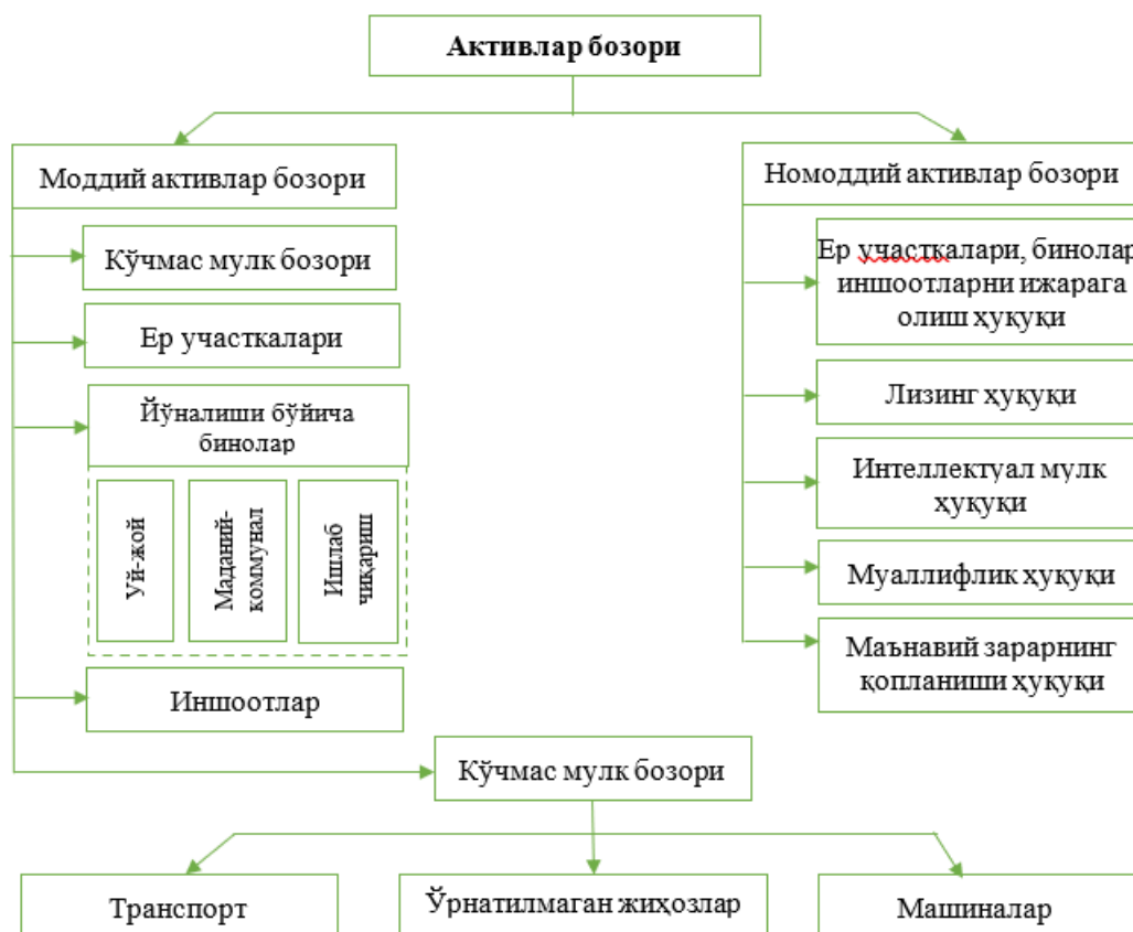
3-расм. Бозор иқтисодиёти шароитида оборотга жалб этиладиган асосий моддий ва номоддий асосий фондлар

Ўзбекистон Республикасида бозор муносабатларига ўтиш ушбу моделининг ўзига хос хусусиятларига мувофиқ иқтисодий ислоҳотларнинг ғоят муҳим вазифаси давлат мулки монополизмини тугатиш ва бу мулкни хусусийлаштириш ҳисобига кўп укладли иқтисодиётни реал шакллантиришдан иборат бўлди. Бунда давлат мол-мулки фақат янги мулкдорларга сотиш йўли билангина мулкчиликнинг бошқа шаклига айлантирилиши мумкин. Хусусийлаштиришнинг пуллилиги қуйидаги қатор омиллар билан шартланган: