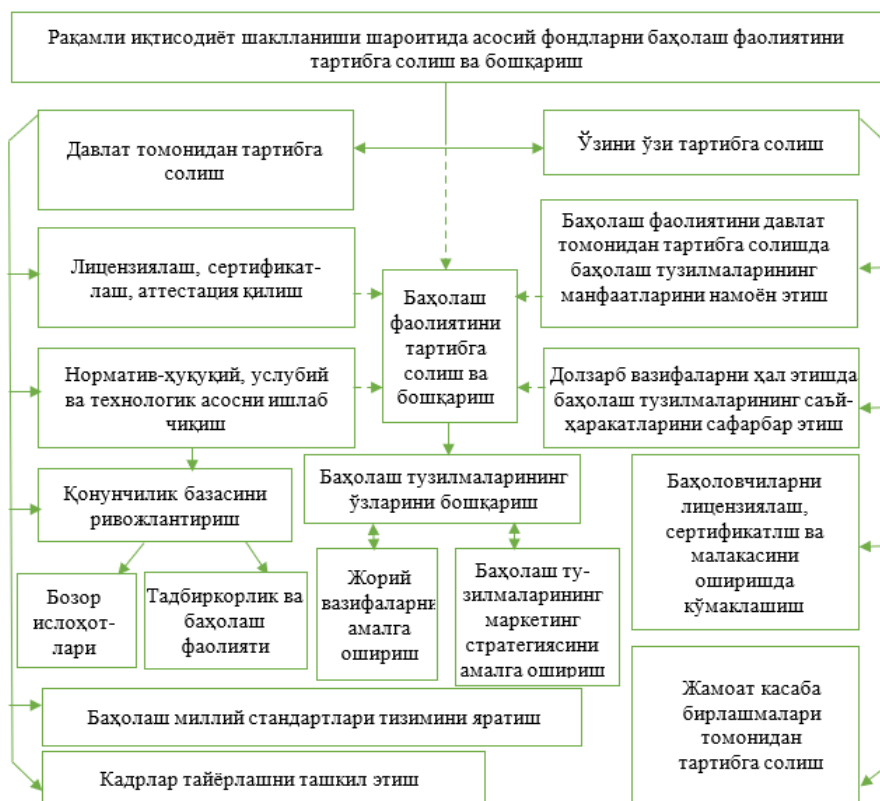
2-расм. Рақамли иқтисодиёт шаклланиши шароитида асосий фондларни баҳолаш фаолиятини тартибга солиш ва бошқариш

Баҳолаш фаолиятини (давлат ва жамоат касаба бирлашмалари томонидан) тартибга солиш баҳолаш фаолиятини ушбу тузилмаларни ривожлантириш стратегик маркетингга мувофиқ баҳолаш тузилмаларининг ўзлари томонидан бошқариш билан узвий боғланиши керак. Шунингдек, баҳолаш фаолиятини тартибга солиш ва бошқаришнинг барча таркибий қисмлари ҳам тадбиркорлик фаолиятининг тури сифатида, ҳам бозор иқтисодиётининг муҳим таркибий қисми сифатида баҳолаш фаолиятини шакллантириш ва ривожлантиришга йўналтирилган чора-тадбирларнинг ўзаро боғлиқ мажмуини ўзида намоён этади. Шу муносабат билан баҳолаш фаолиятига, унинг капиталистик иқтисодий тизимнинг ривожланишидаги ўрнига, шунингдек, унга асос қилиб олинган асосий иқтисодий тамойилларни амалга оширишга нисбатан ёндашув ҳам тубдан ўзгарди.