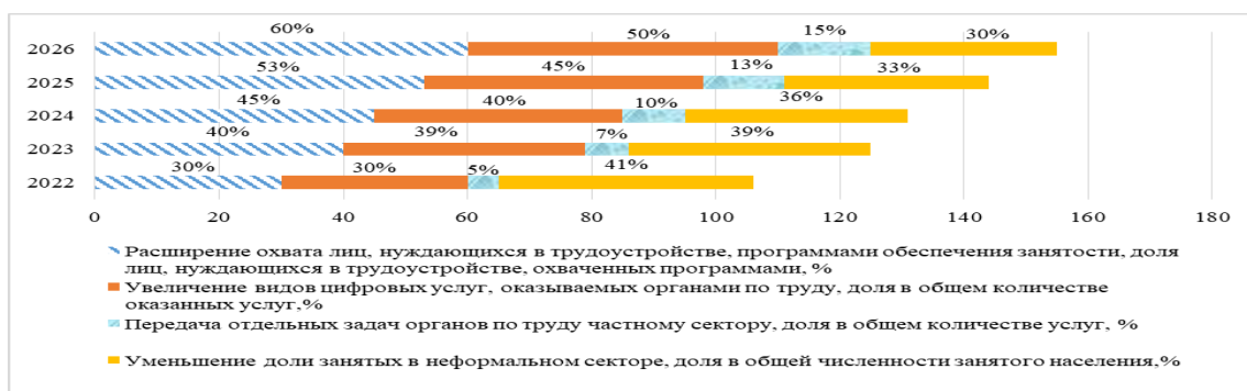
Рис. 3. Целевые показатели сокращения доли неформальной занятости в Узбекистане на 2022-2026 годы, %

В целях сокращения доли неформальной занятости в Узбекистане принята соответствующая программа – «дорожная» карта 5 , в соответствии с которой будут реализовываться основные направления по достижению соответствующих параметров снижения. Например, доля лиц, нуждающихся в трудоустройстве и охваченная программами обеспечения занятости увеличится с 30% (2022 г.) до 60% (2026 г.). Увеличатся виды цифровых услуг, оказываемых органами по труду, что позволит повысить долю в общем количестве оказанных услуг с 30% (2022г.) до не менее 50% (2026 г.). Планируется активизировать передачу отдельных задач органов по труду частному сектору с 5% до 15% (рис. 3).