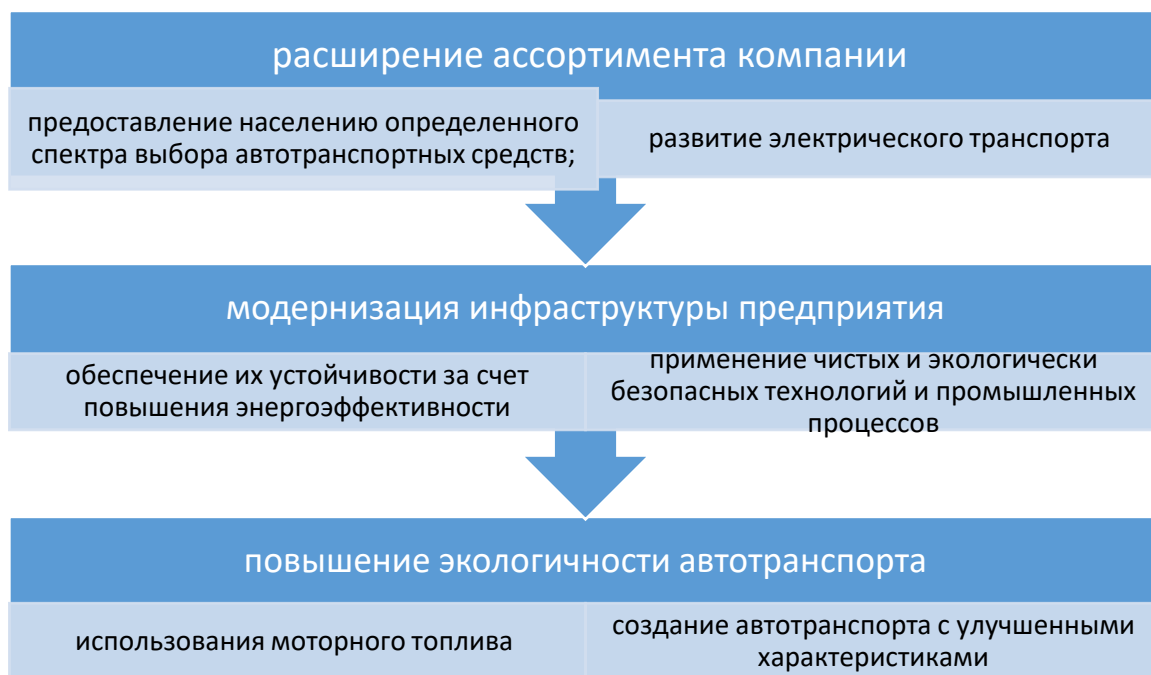
Рисунок 2. Пути реализации Стратегии развития Республики Узбекистан до 2035 г. АО «Узавтосаноат» 3

Перспективным направлением является разработка и использование материалов, которые не содержат токсичных веществ и не наносят вред окружающей среде при производстве, использовании и утилизации и разработка новых процессов производства, которые минимизируют расход воды, энергии и сырья.