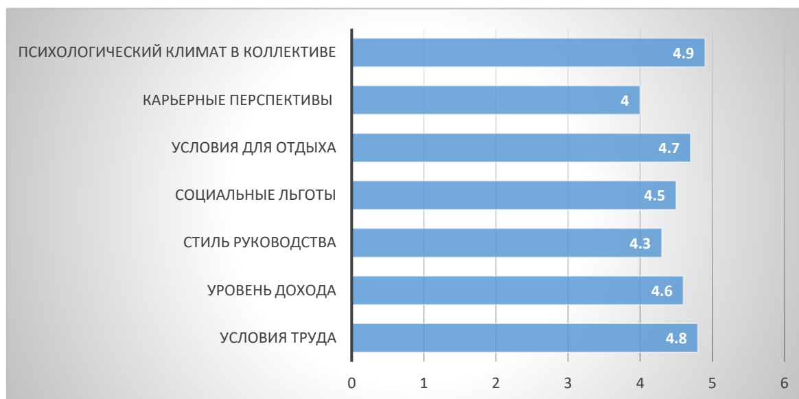
Рисунок 1. Результаты анкетирования персонала в GM Powertrain Uzbekistan об удовлетворенности трудом

системе. Средние результаты, полученные в результате анкетирования, приведены на рис.2.1.2.