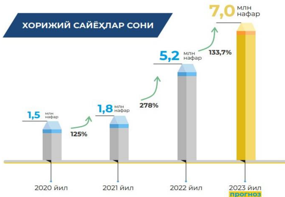
3-Расм. Ўзбекистон Республикасига ташриф буюрган хорижий туристлар сони ва прогнози 7

2022 йил давомида мамлакатимизга ташриф буюрган хорижий туристлар сони 5,2 миллион нафар (йиллик режа-2,7 миллион нафар) ни ташкил этди, 2023 йилда мамлакатимизга ташриф буюрадиган туристларнинг сифими 7,0 миллион нафар, 2022 йилга нисбатан 133,7 фоизга ошиши прогноз қилинмоқда (3-расм).