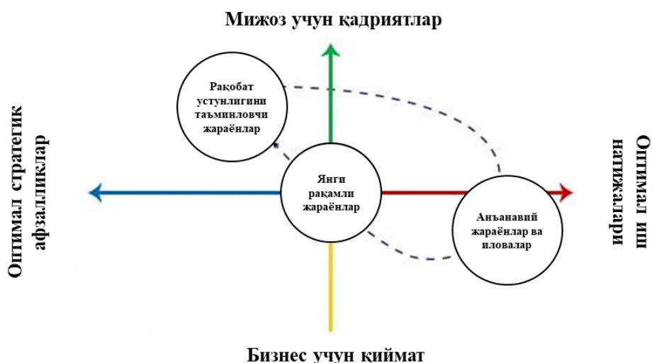
2-расм. Рақамли ҳаракатларни қўллаш учун мақбул нуқталар

Бундан кўриниб турибдики, бизнес фаолиятида рақамли трансформациядан барча манфаатдор томонлар учун фойда олишни бошлаш вақти келди. Кўпчилик, масалан, мобил платформага ўтишни трансформация деб ҳисоблайди, бу ўтиш мижозлар, ходимлар ёки бизнес ҳамкорларнинг ҳақиқий манфаатларига қандай таъсир қилишига эътибор бермайди. Аммо, биз қисқа муддатга мўлжалланган ички самарадорликнинг кескин ошишини кўришимиз мумкин. Бу рақамлаштиришнинг биринчи қадамлари, биз бунга мувозанатли ёндашадиган ҳеч кимни кўрмаслишимиз мумкин. Ҳа, аксарият бизнес фаолияти вакиллари самарадорлик ва сотишни яхшилашга муваффақ бўлмоқда, бироқ кам сонлилар рақамлаштиришнинг афзалликларига ижодий ва мувозанатли тарзда яқинлашмоқда. Шу боис ҳам бизнес фаолияти вакиллари ўз тезлигини ошириш учун учта катта қадам қўйиши муҳимдир (2-расм).